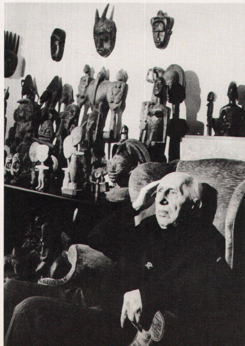
Norbert Elias, über 90jährig, in seinem Heim in Amsterdam