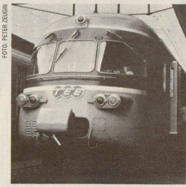
Exklusiv durch den Gottardo und zurück: Der frühere TEE-Zug «Gottardo», heute als EC im Gotthardverkehr und auf der Simplonlinie im Einsatz.

(Der vollständige Text ist erhältlich bei: ABS, Baslerstrasse 106, 8048 Zürich.)