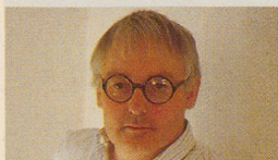
Gestalter Bruno Rey erfand den Stuhl, auf dem fast jeder schon einmal gesessen hat. Seite 30