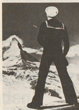
Heimatszenen – Schauplätze des Schweizer Films. Seite 38