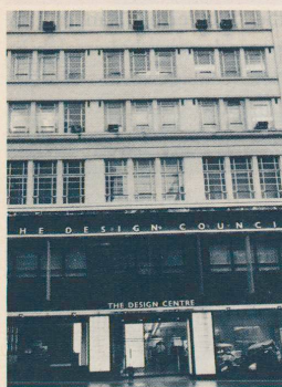
Londons Haymarket: Sitz des British Design Council, der grössten staatlichen Designförderungsstelle. Seite 53