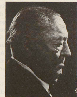
Alvar Aalto oder Mies van der Rohe?