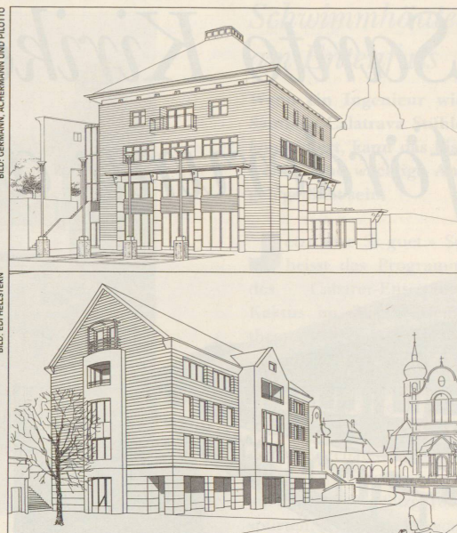
Zwei Gewinner, kein Bau: das Altdorfer Projekt (oben), das einheimische (unten).