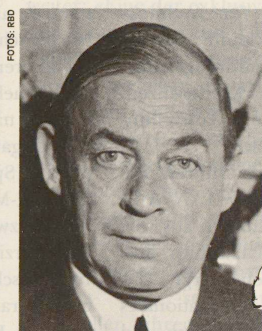
Mies van der Rohe oder Alvar Aalto?

D ie Tragtaschen der renommierten Architekturbuchhandlung K. in Z. sind einerseits mit Porträts der Grossen der modernen Architektur, andererseits mit Köpfen der modernen Malerei bedruckt. Ein Who is who von Aalto bis Wright, von De-launay bis Warhol, in dem ich getrost nach Hause tragen kann, was ich soeben schwarz auf weiss erworben habe. Who is wirklich who? Ist A. wirklich Aalto? Und M. wirklich Mies? Oder ist M. nicht vielmehr A. – und umgekehrt? Tatsächlich: Umgekehrt wäre richtig, umgekehrt wäre der richtige Kopf am richtigen Namen. Ein neckisches Vexierspiel, diese Ahnengalerie auf Polyäthylen. Auf die Lösung kam ein «Hochparterre»-Leser, der bei K. ein Buch über den Architekten A. kaufte – und stutzig wurde: Who is who auf dem Plastiksack?