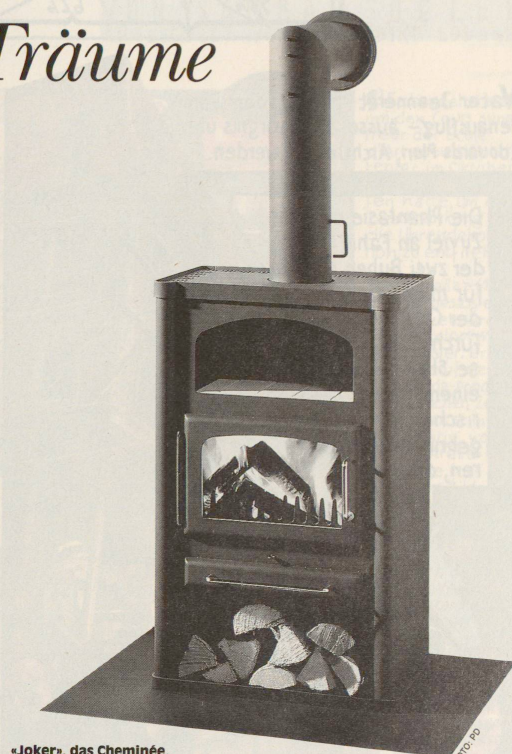
«Joker», das Cheminée, das keinen eigenen Schornstein mehr braucht.

Flackernder Feuerschein, der Teekessel summt, draussen fällt der Schnee – eine Idylle, von der die meisten von uns nur träumen können. Aber Träume gehen ab und zu doch in Erfüllung: Die Kaminöfen der Bauart 1 der Hamex AG können an einen bereits mit anderen Öfen für feste und flüssige Brennstoffe belegten Schornstein angeschlossen werden. Nun dürfen sich alle, die bis jetzt mangels geeignetem Schornstein auf einen Kaminofen verzichten mussten, ihren Herzenswunsch erfüllen. Der Ofen kann als Zusatzheizung, als Hauptwärmespeicher, als Backofen oder als Kochherd verwendet werden. Der Betrieb ist ausschliesslich bei geschlossener Feuerraumtür vorgesehen. Die Masse des Modells «Joker» betragen 850 x 550 x 390 mm, und es erreicht eine Nennwärmeleistung