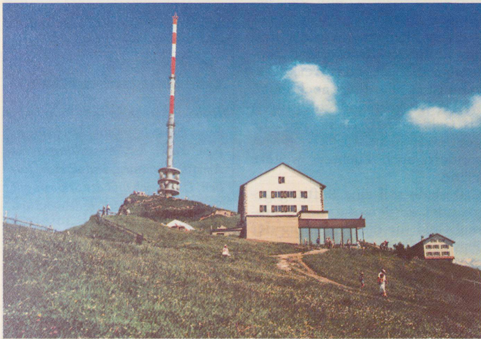
Der bestehende Antennenturm auf Rigi-Kulm (oben) ist 50 Meter hoch. Der Nachfolger soll nicht nur mehr als doppelt so hoch werden, sondern auch mit riesigen Parabolspiegeln bestückt sein (unten).

Ein Antennenturm auf Rigi-Kulm durchlöchert schon seit bald 30 Jahren das vielzitierte Ideal der «freien Rigi». Nun planen die PTT jedoch als Neubau ein doppelt so hohes, massives, rot-weiss geringeltes Monstrum.