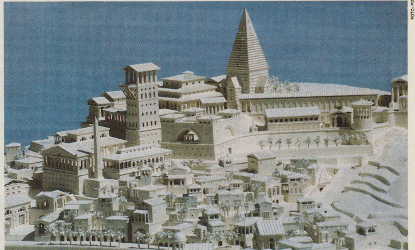
Modell Atlantis – Ausschnitt: Alles Gute soll an einem Ort versammelt werden, vor allem Stadtraum.