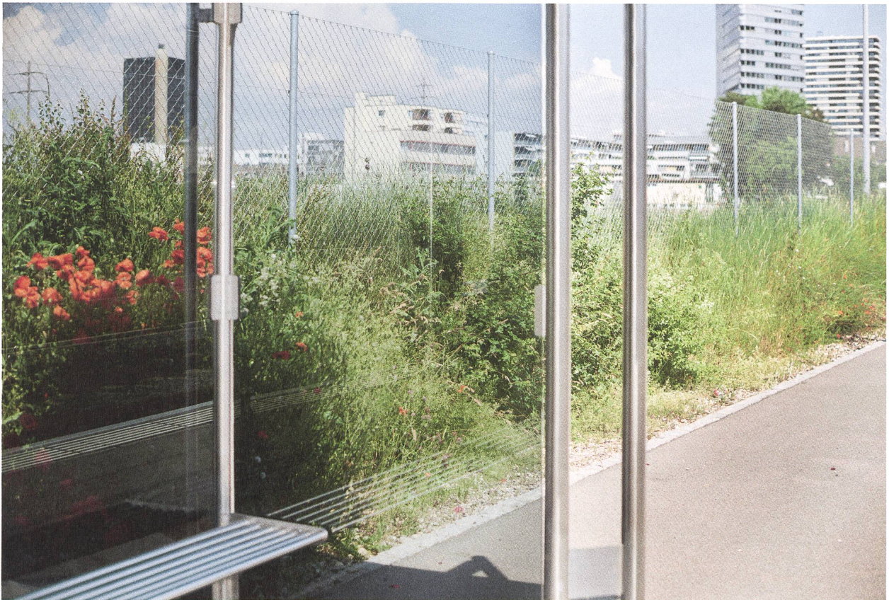
Areal Gleis Süd und Haltestelle der Tramlinie 14.