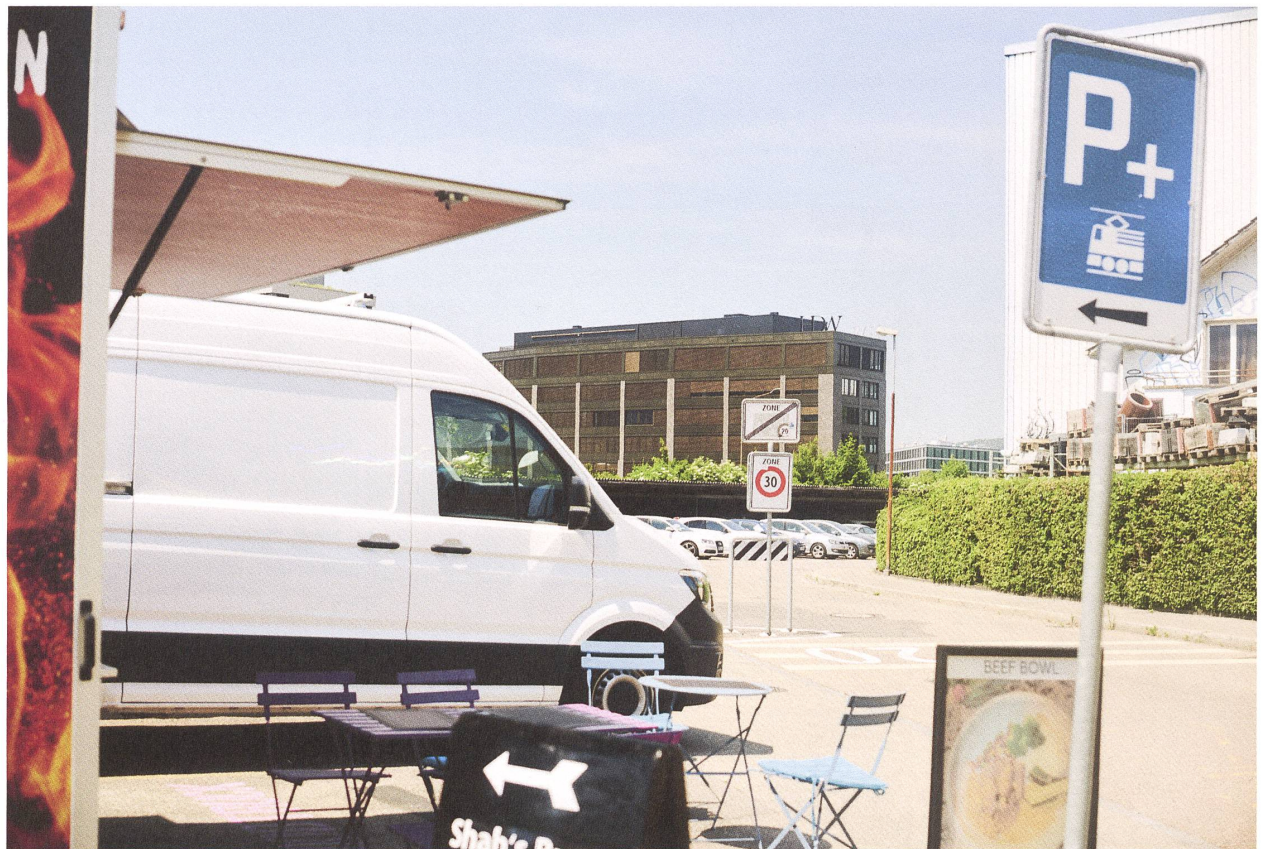
Areal Chuenimatt und Imbiss am Bahnhof Pratteln.