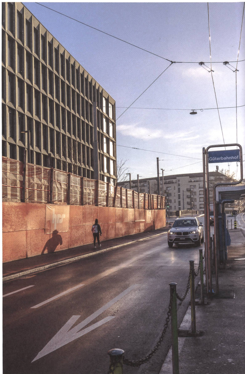
Mächtig steht das PJZ, wo sich der Güterbahnhof befand. Bald kommt eine Kantonsschule dazu.

Doch ein Gebäude mit mehr als 54 000 Quadratmetern Geschossfläche ist kein normales Haus – Städtebau hin oder her. Und mit der Erweiterung würde das Gebäude noch wachsen. Das PJZ spielt flächenmässig in der Liga eines Toni-Areals. Zu einer derartigen Dimension kann man entweder mit einer Ausnahmearchitektur stehen oder sie in einzelne, durchlässige Hausteile auflösen, wie zum Beispiel bei der Europaallee. Theo Hotz Partner tun weder noch. Sie verbergen die Baumasse hinter einer Regelfassade, die sich fast komplett um das Ganze herumzieht. Das Gebäude hat zwar drei Höfe, aber nur eine Fassade. Die unbeliebte, aber öffentliche Nutzung scheint sich hinter einem unendlichen Büroraster verstecken zu wollen. Statt aus der Grösse Kraft zu schöpfen, verliert sich das Gebäude in der Repetition. Kurzum: Das PJZ ist nicht zu gross. Seine Fassade ist zu klein. Andres Herzog