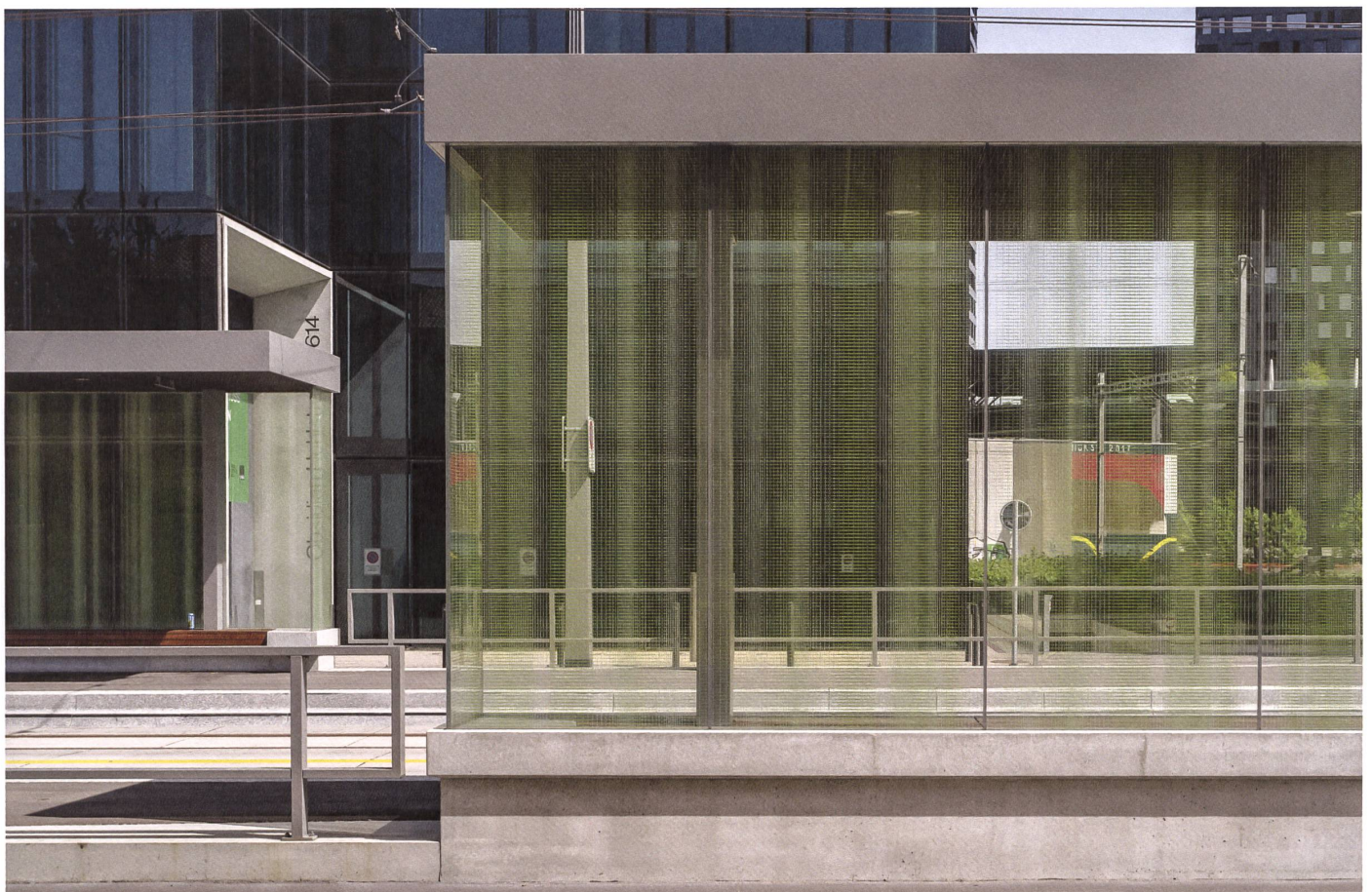
Zürich: An der Haltestelle Seidelhof dominieren klare Kanten – die der Wartehalle und die der Bauten im Hintergrund. →