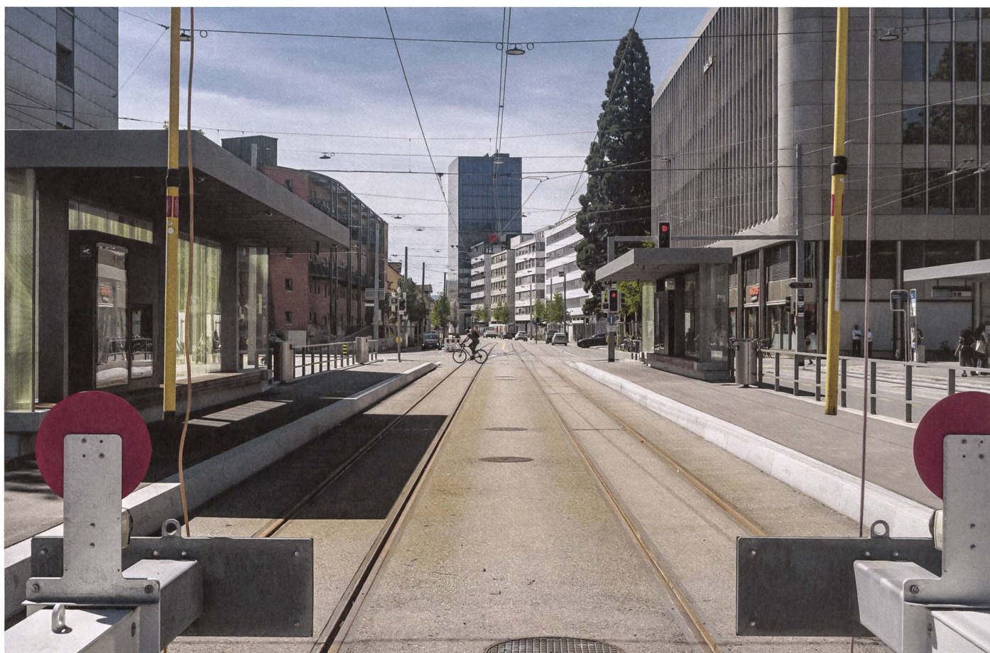
Zürich: Von den Prellböcken aus geht der Blick Richtung Westen ins zunächst städtisch geprägte Limmattal. →

Länge des Tals: Gerade mal 36 Kilometer legt der Fluss zwischen der Quaibrücke in Zürich und der Mündung in die Aare in Lauffohr bei Brugg zurück. Zehnmal länger ist der Schweizer Abschnitt des Rheins, achtmal länger die Aare. Dafür müssen die Zürcher «ihre» Limmat nur mit einem Kanton teilen, dem Aargau. Die Kantonsgrenze hat ihren heutigen Verlauf erst seit der Gründung des Kantons Aargau 1803. Zuvor hatte sogar für kurze Zeit ein Kanton Baden existiert, zu dem auch Dietikon, Schlieren und Hütikon gehörten. Mit dem Ende der Helvetischen Republik kamen diese Gemeinden zum Kanton Zürich. →