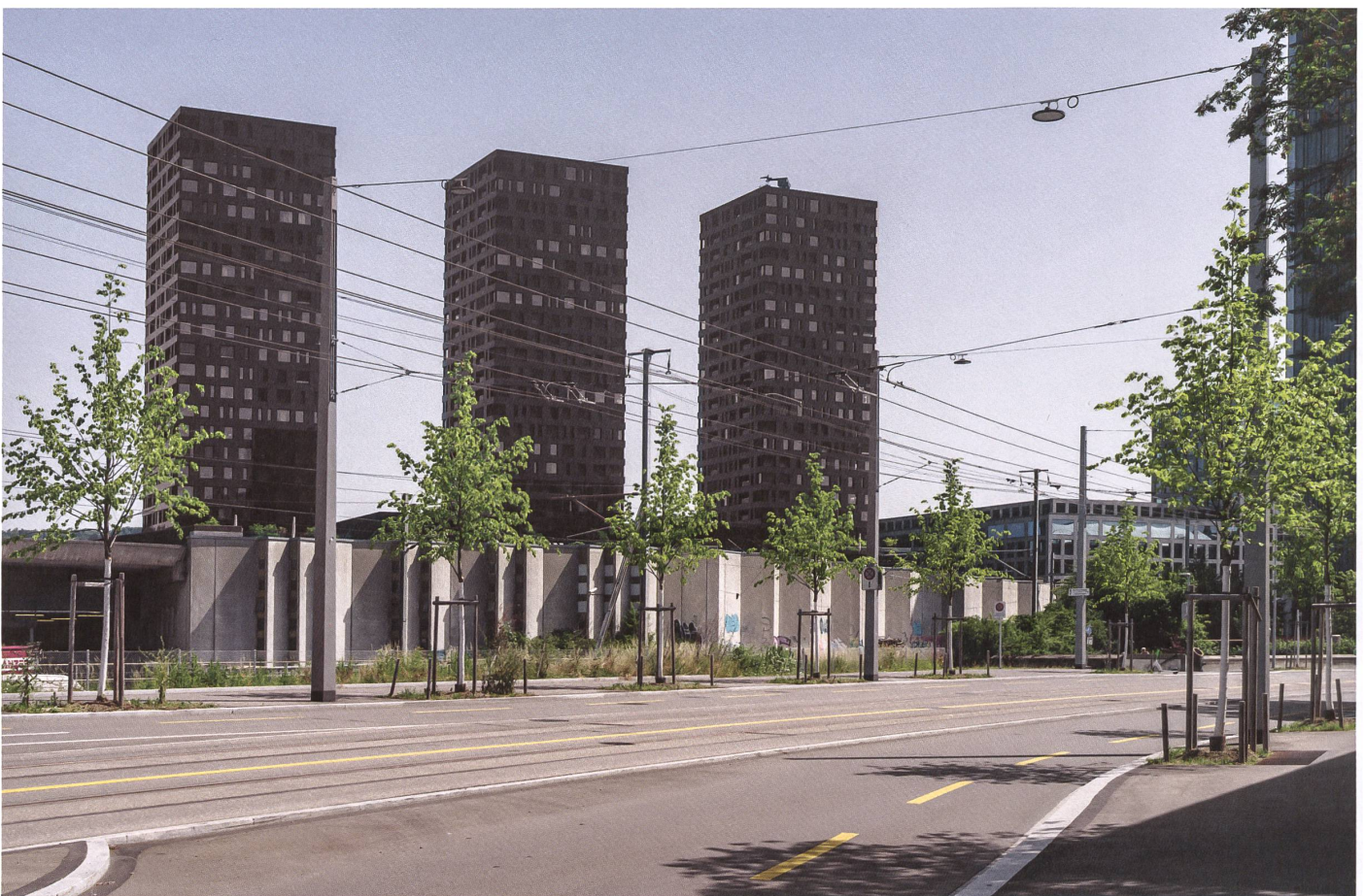
Zürich: Zwischen Seidelhof und Farbhof überragen die Türme der Überbauung Vulcano das Trasse. Hier verkehrt auch der Trolleybus, weshalb es nicht begrünt ist. →

Nach dem Shoppingcenter wollten die Investoren in Spreitenbach mit dem Tivoli noch höher hinaus. Es sollte mehr sein als ein Einkaufszentrum: ein Komplex mit vielfältigen städtischen Funktionen, einem Hotel und Wohnungen, einem Kongresszentrum und einem Mehrzwecksaal. Doch kaum war 1974 das erste Fragment des Tivoli – ausgerechnet das Einkaufszentrum – eröffnet, ging die Bauherrschaft in Konkurs. Die Ölkrise hinterliess ihre Spuren. Die Wachstumseuphorie war dahin, und Grosssiedlungen wie