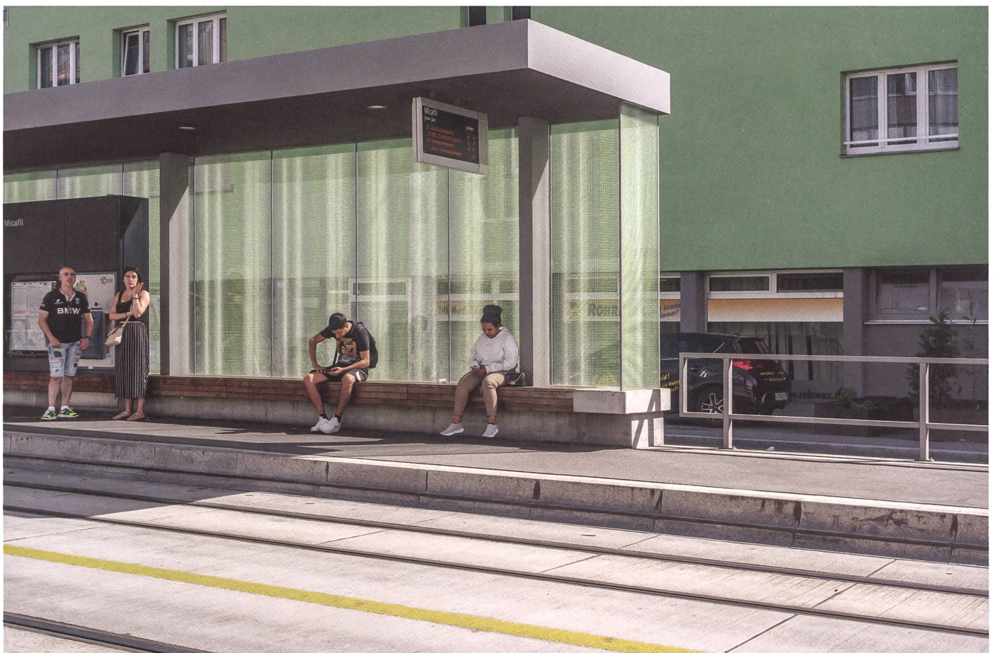
Zürich: Die Haltestelle Micafil zeugt von einem ehemaligen Industriebetrieb. In der Verglasung des Wartebereichs erzeugt die Sonne ein Lichtspiel. →

Auch der Industriestandort Limmattal geriet unter Druck. Die Schliessung der traditionsreichen Wagons- und Aufzügefabrik Schlieren 1985 war ein Schock über den Ort hinaus – und es blieb nicht der einzige: Geistliches Leim- und Düngerfabrik «Lymi», die Stückfärberei «Färbi» und das Gaswerk «Gasi» machten ebenfalls dicht. Es begann eine Abwärtsspirale, die 2003 ihren Tiefpunkt erreichte. «Leben im Abfallkübel des Kantons» betitelte der «Tages-Anzeiger» einen Beitrag über Schlieren. Die Behörden hatten die Zeichen der Zeit bereits erkannt und die Zukunft des Orts in die Hand genommen. Leitbild und Stadtentwicklungskonzept waren Stationen auf dem Weg zur Besserung. Am augenfälligsten – und für das städtische Selbstverständnis am wichtigsten – ist die Umgestaltung des Zentrums. Dabei nutzten die Stadtentwicklerin und die Planer geschickt – und so konsequent wie nirgendwo sonst – die Dynamik, die die Planung der neuen Bahn ins Limmattal mit sich brachte. ●