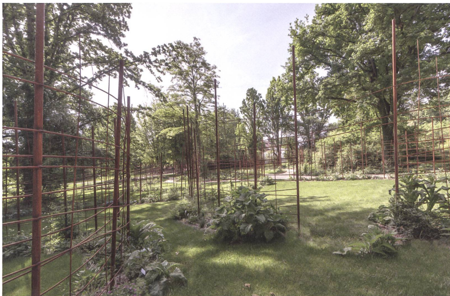
Ein neues Spalierlabyrinth für die Clematis-Sammlung.