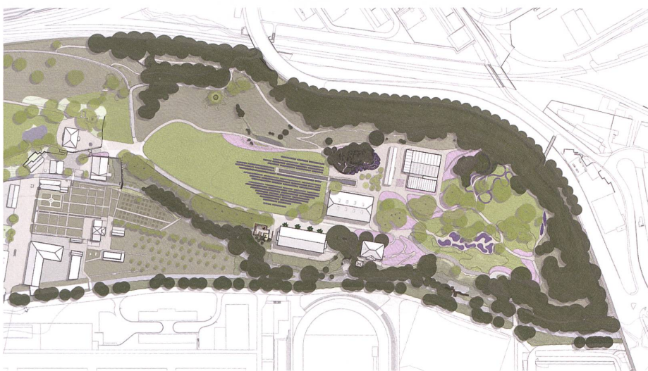
Nach der jüngsten Umgestaltung vereinigen die Merian-Gärten in Basel ihre verschiedenen Zeitschichten.