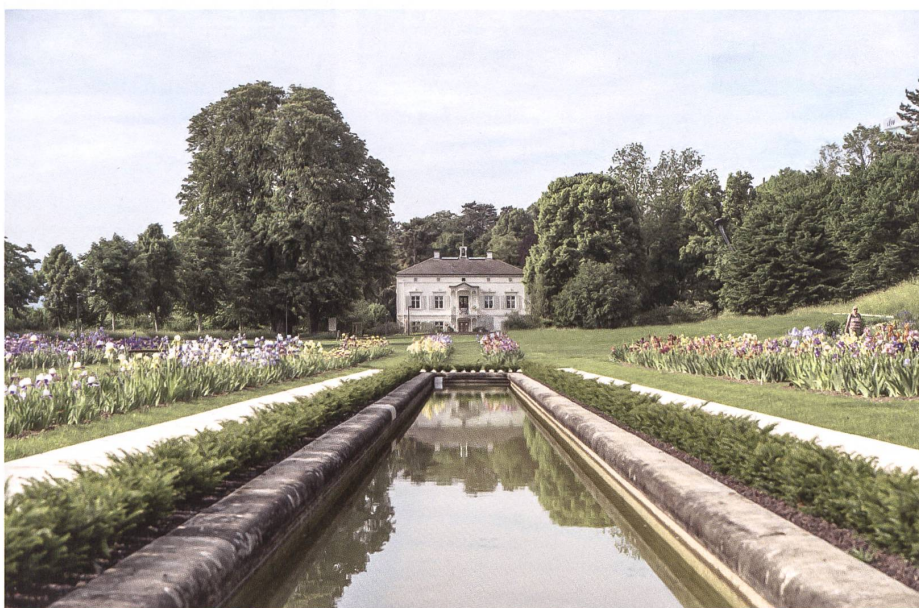
Staudenbeete umrahmen das lange Wasserbecken der «Grün 80».