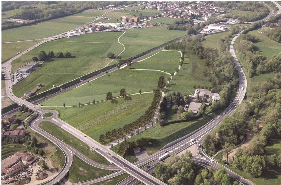
Das Bild von morgen – dank einer Änderung des kantonalen Nutzungsplans: Felder, Bäume, Flussufer, Spazierwege.

Beteiligte: Gran Consiglio (Kantonsparlament); Repubblica e Cantone Ticino, Dipartimento del Territorio (Raumplanungsamt), Bellinzona; Verein Cittadini per il territorio, Mendrisio (mit Unterstützung der Società agricola del Mendrisiotto und weiterer Natur- und Umweltschutzorganisationen)