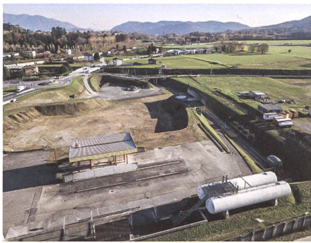
Agglomerationslandschaft Mendrisiotto heute: Landschaftsbrüche zwischen Verkehrswegen.