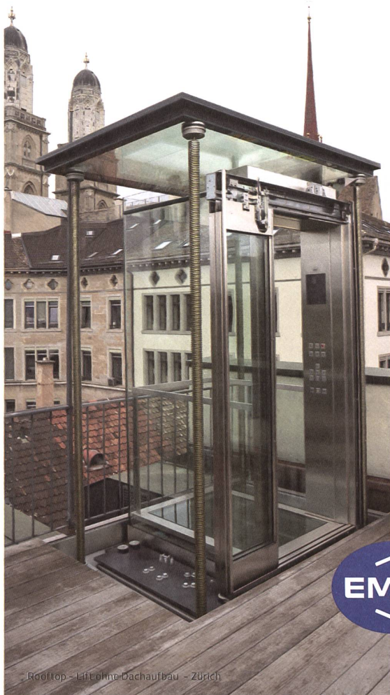
RoofTop - Lift ohne Dachaufbau - Zürich

Bewegt weltweit – Massarbeit aus der Lift- Manufaktur.