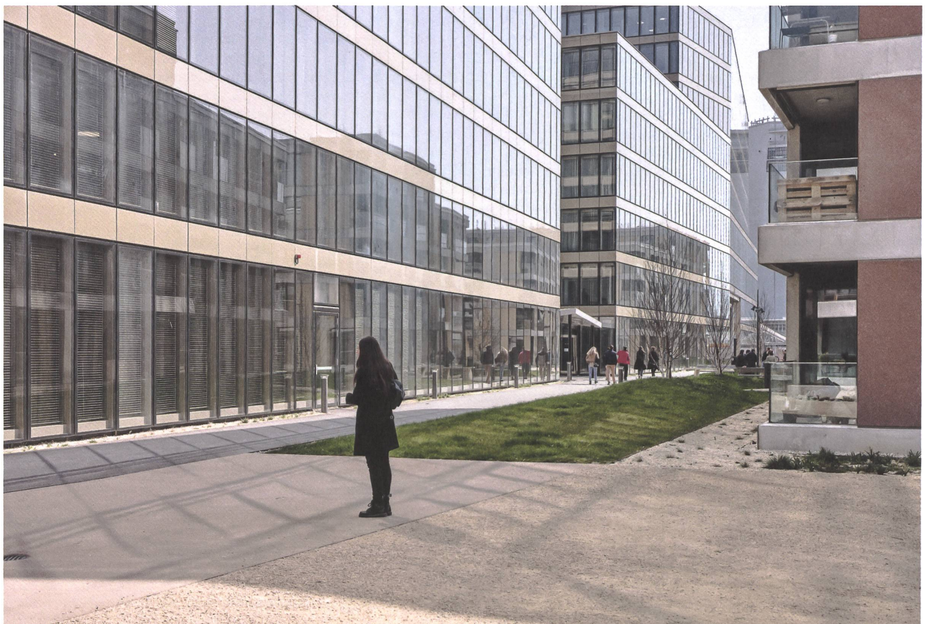
Des bâtiments en verre hébergent le siège des CFF et le centre de formation pour la Suisse romande. | Glasbauten mit SBB-Hauptsitz und Ausbildungszentrum Westschweiz.