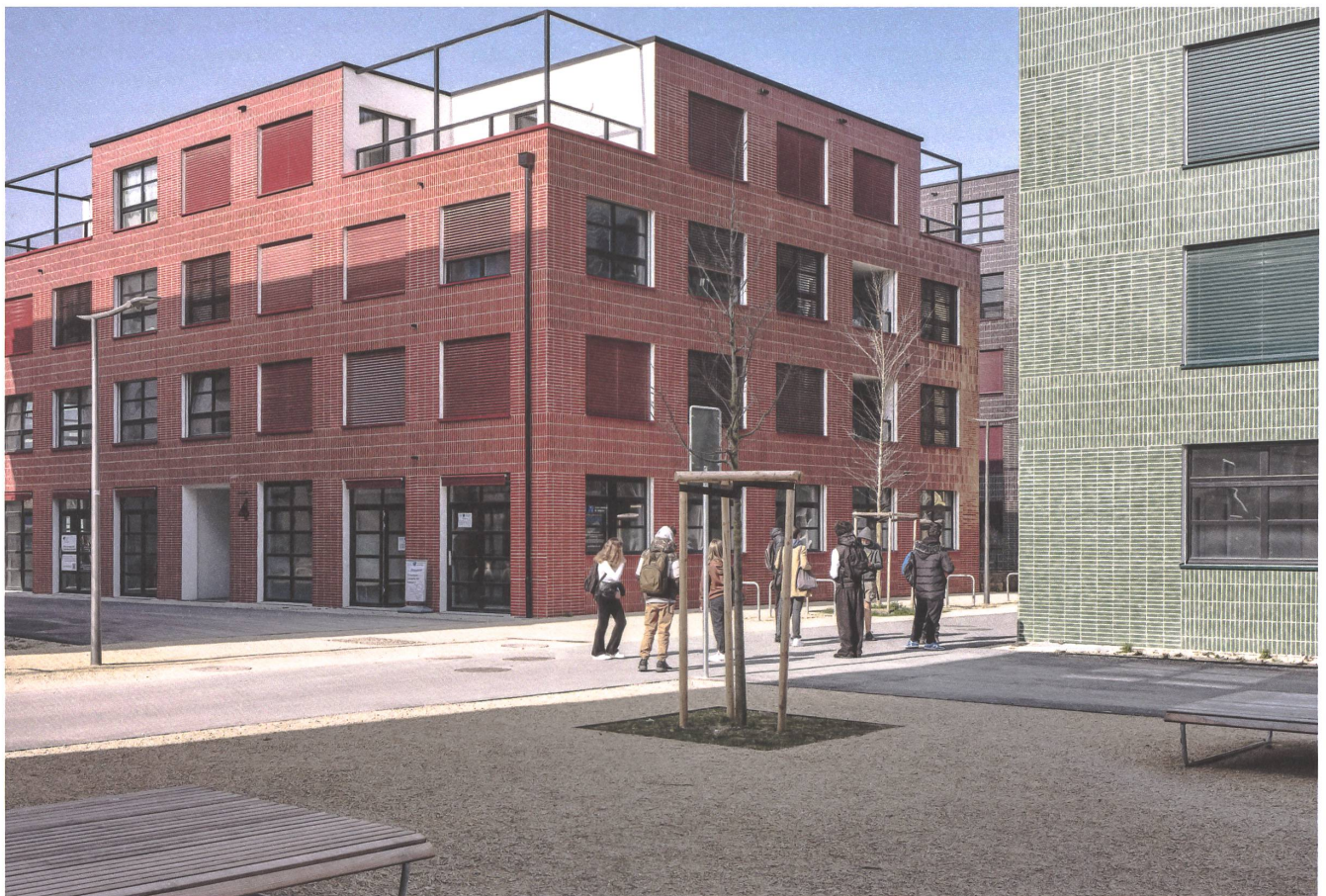
Un réseau de chemins et de places est tissé à travers le nouveau quartier. | Ein Netz von Wegen und Plätzen durchmisst das neue Quartier.