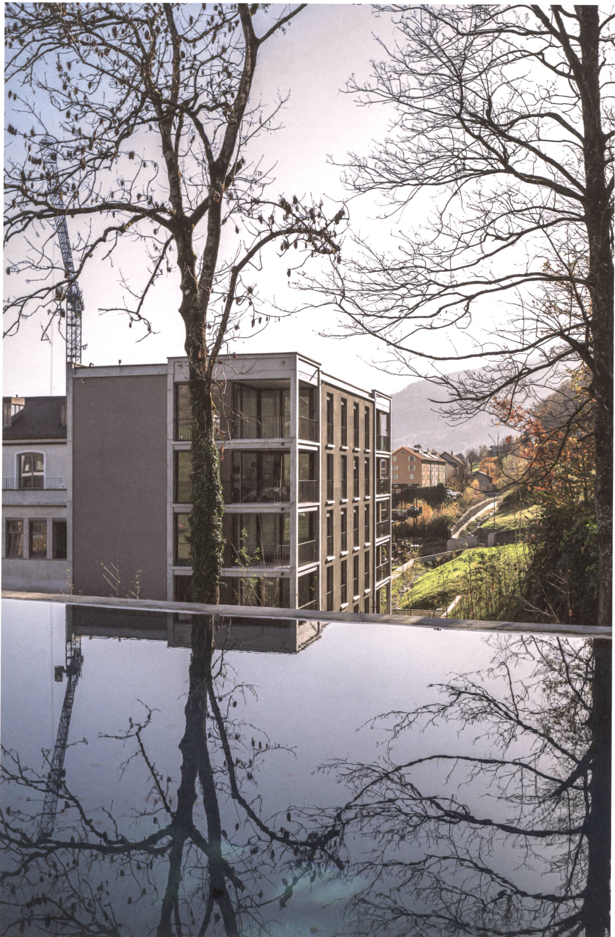
Der nicht mehr gebrauchte Weiher der Textilfabrik Stoffel wird zum Schwimmbad für die Bewohner der Überbauung Uptown in Mels siehe Seite 24.