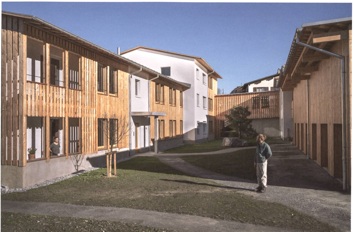
6 Die Laubengänge, der Innenhof und rechts die Remisen des Klimawohnhauses Burggarta von Valendas.