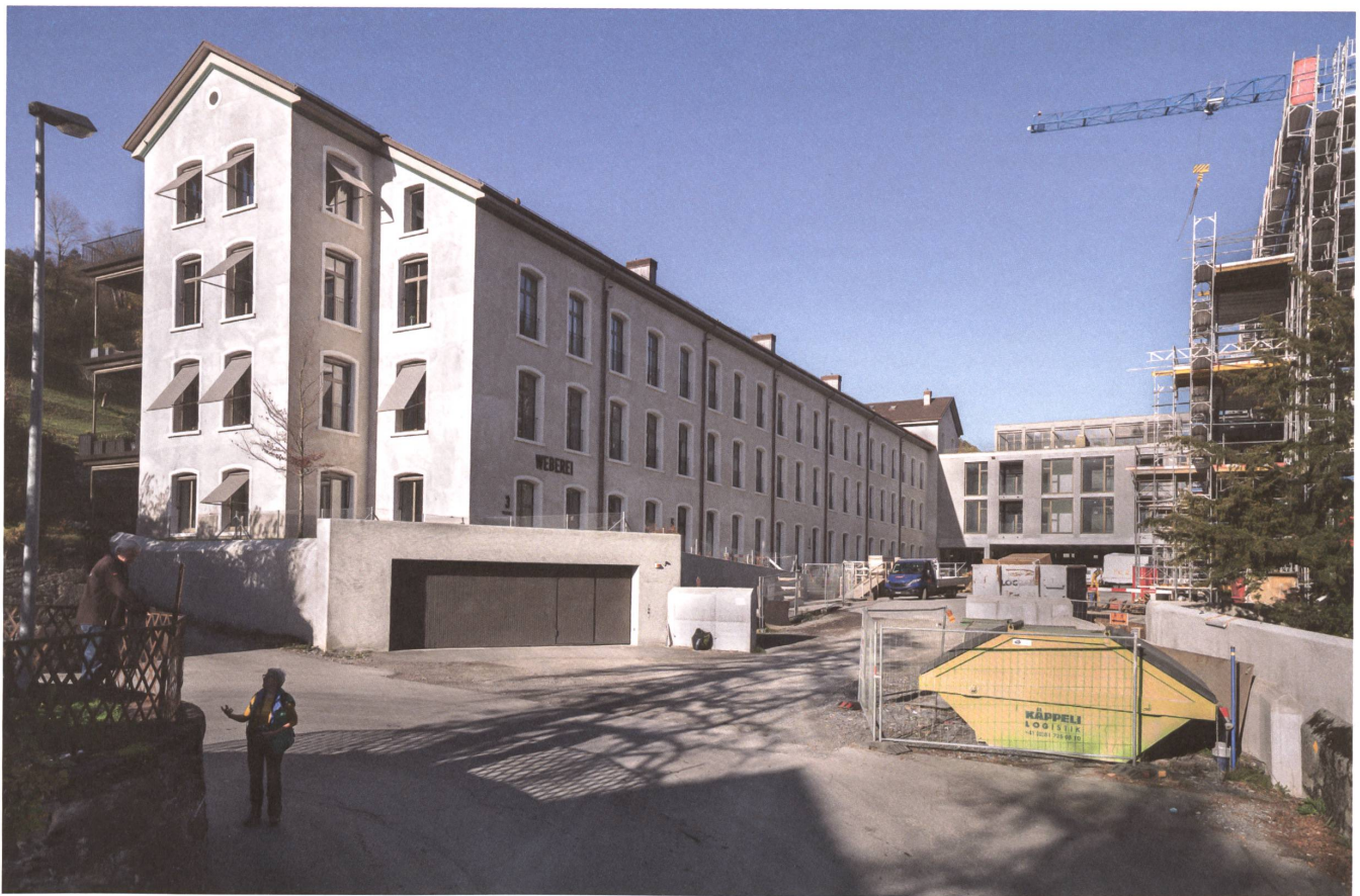
5 Die «Stofflerei»: Statt Baumwolle rüsten, spinnen und weben wohnen in der Textilburg über Mels.