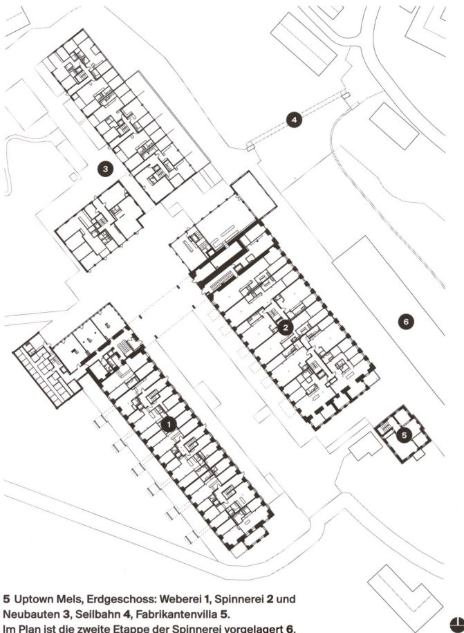
5 Uptown Mels, Erdgeschoss: Webererei 1, Spinnerei 2 und Neubauten 3, Seilbahn 4, Fabrikantenvilla 5. Im Plan ist die zweite Etappe der Spinnerei vorgelagert 6.