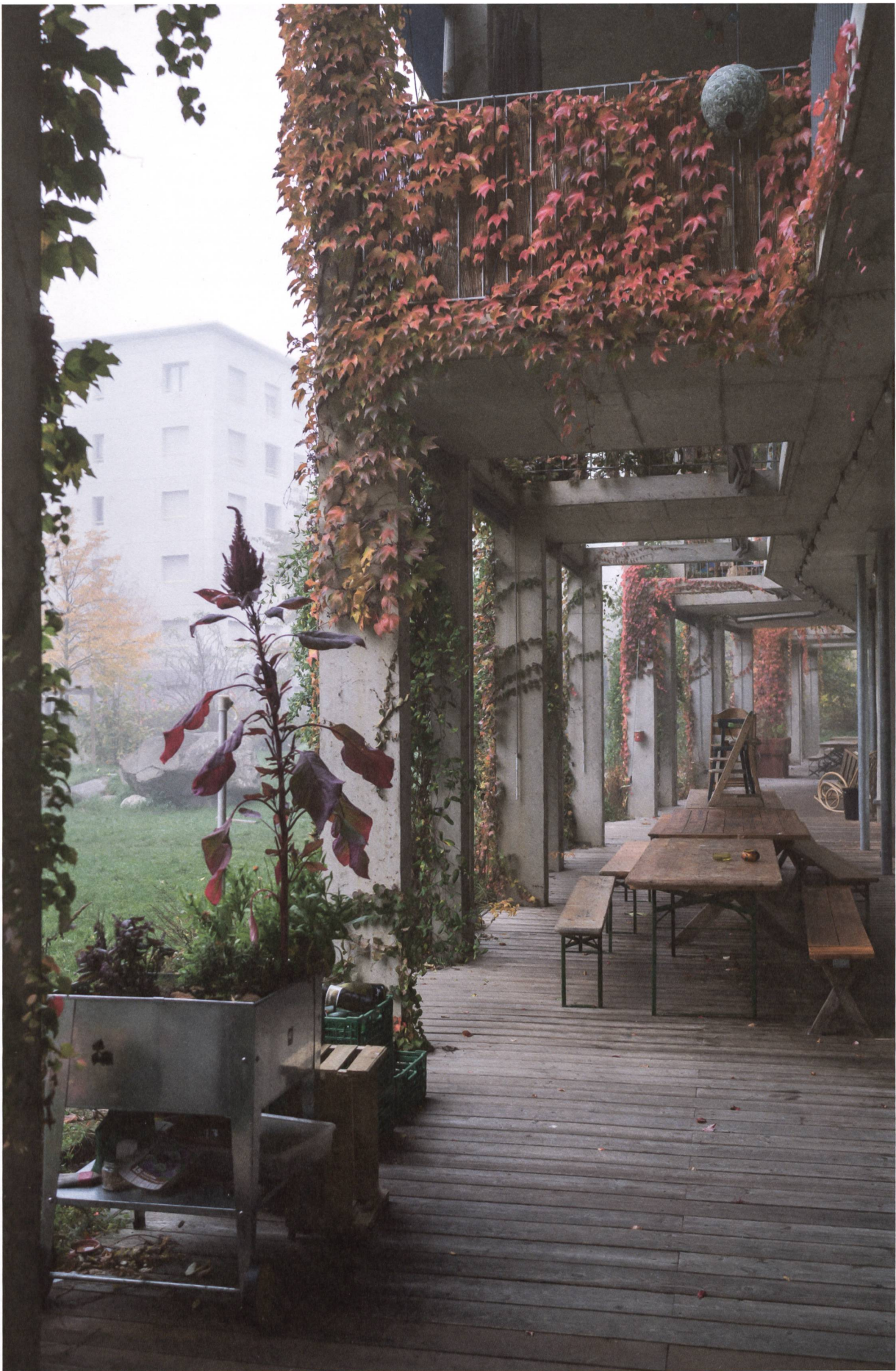
Haus – Laube – Garten: Projekt Soubeyran der Genossenschaften Équilibre und Luciole in Genf-Servette siehe Seite 12.