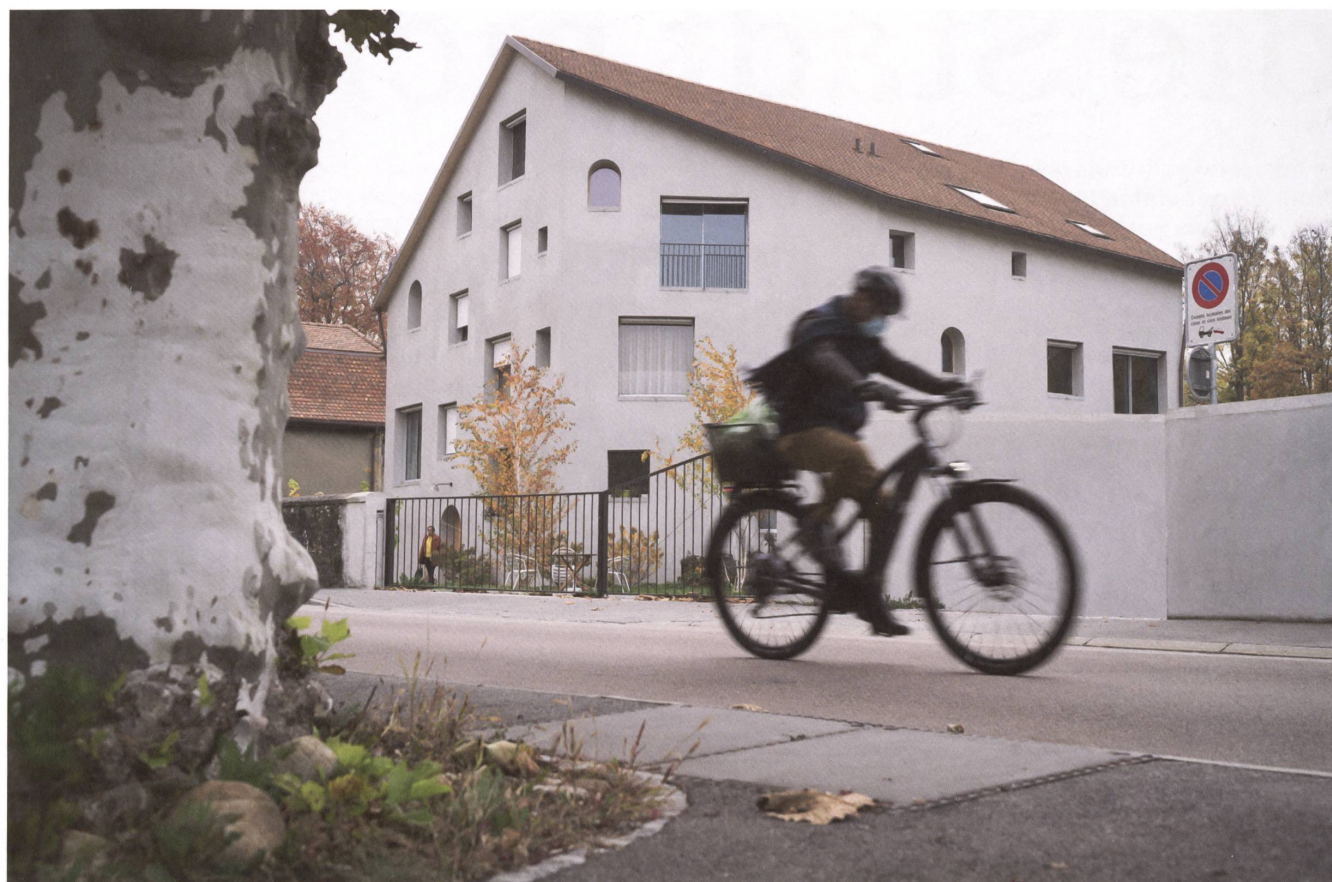
4 Das Mehrfamilienhaus von Auvernier kombiniert Wohnraum für ältere Menschen mit einer Kinderkrippe.