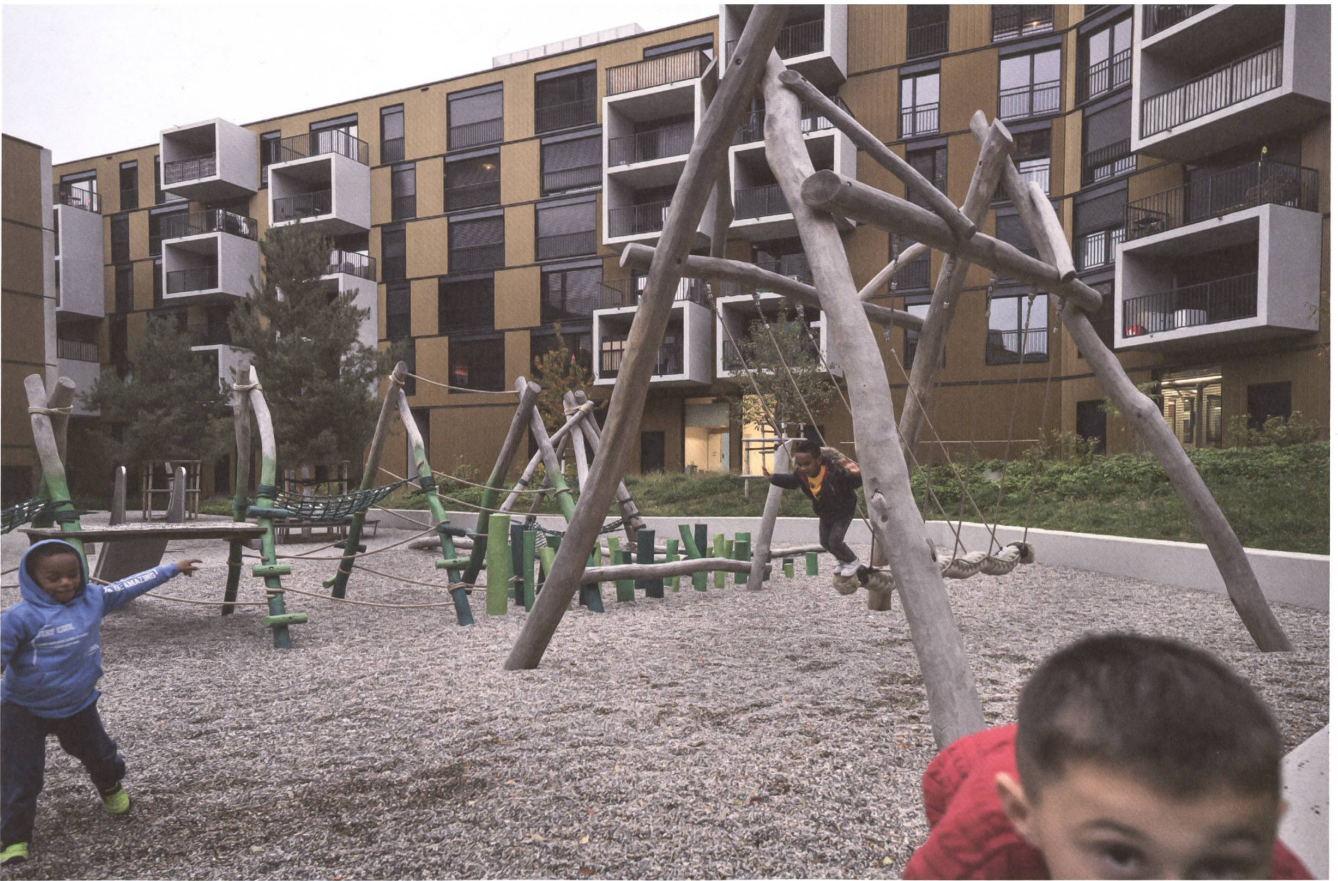
3 Stadtteil Oasis von Crissier: Häuser, Aussen- und Zwischenräume brauchen eine stimmige Balance.