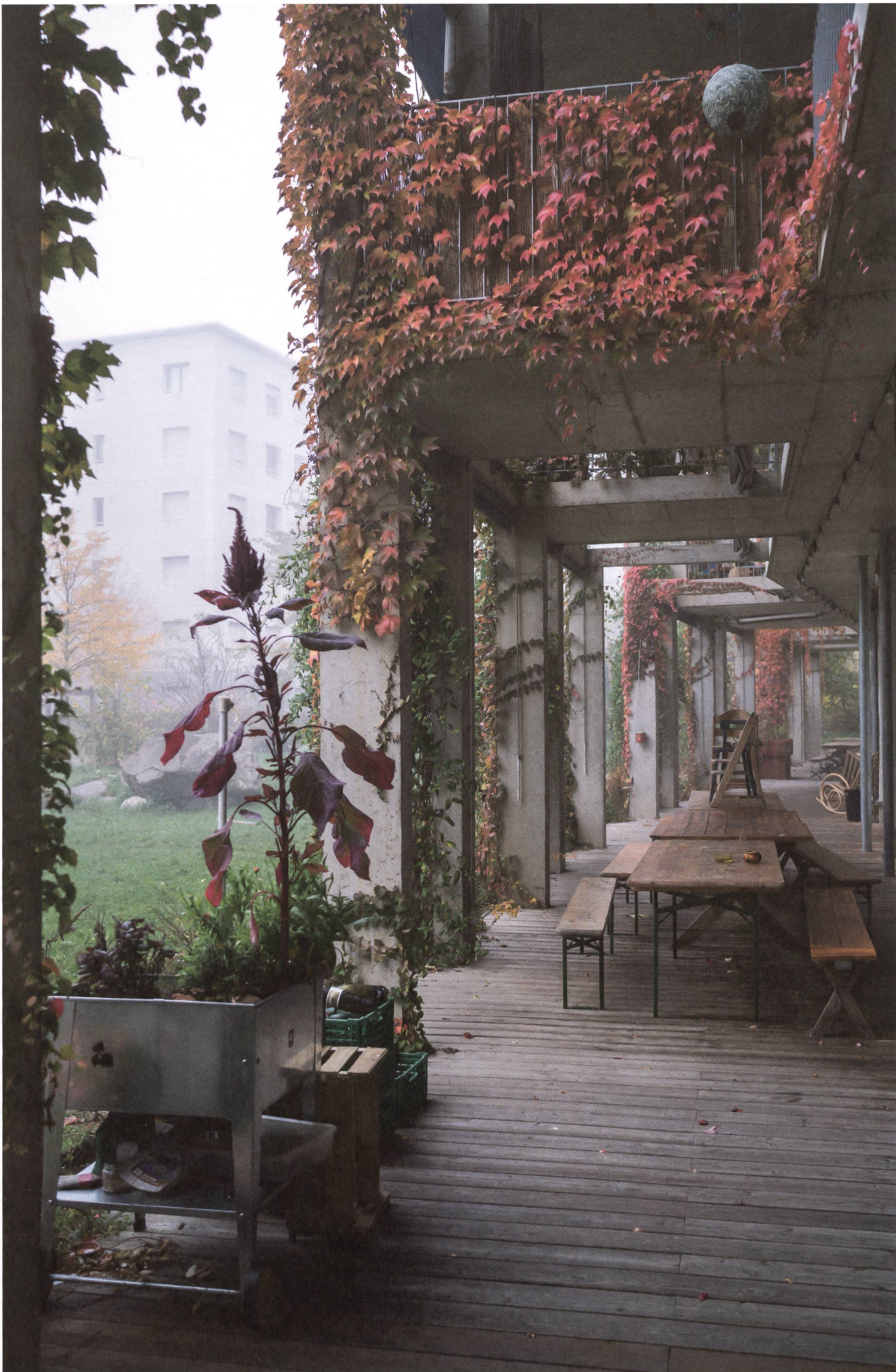
Haus – Laube – Garten: Projet Soubeyran der Genossenschaften Équilibre und Luciole in Genf-Servette siehe Seite 12.