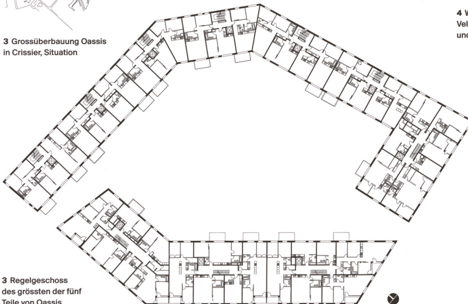
3 Regelgeschoss des grössten der fünf Teile von Oassis.