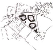
3 Grossüberbauung Oassis in Crissier, Situation

Chemin des Lentillières, Crissier VD Bauherrschaft: Patrimonium / Gemeinde Crissier Architektur: Bauart Architekten, Bern / Neuenburg / Zürich; KCAP, Rotterdam / Zürich Investition: ca. Fr.200 Mio.