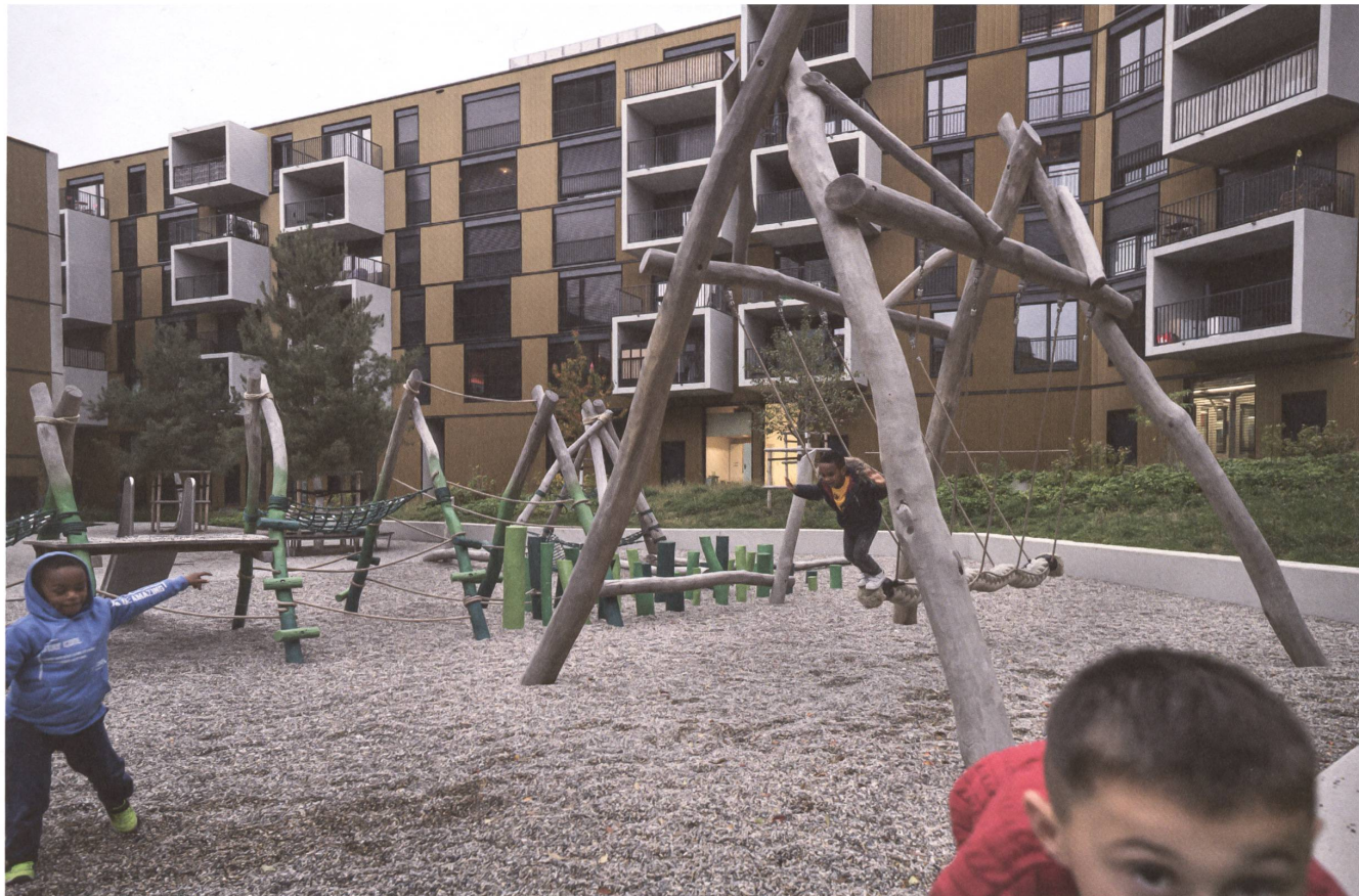
3 Stadtteil Oasis von Crissier: Häuser, Aussen- und Zwischenräume brauchen eine stimmige Balance.