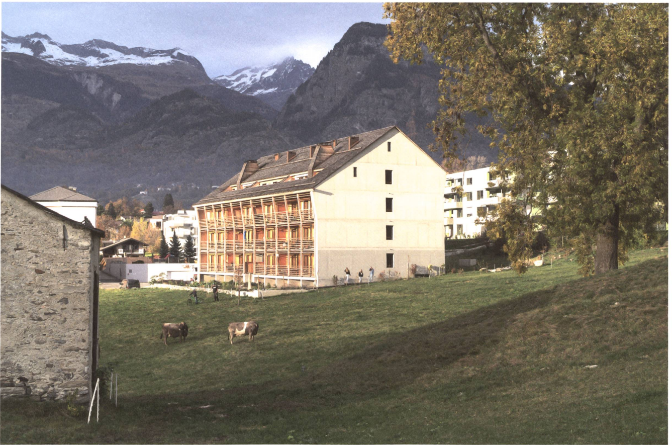
1 Die Schwestern von St. Ursula in Brig bauten mit Blick auf Gemeinschaft und Nachbarschaft.