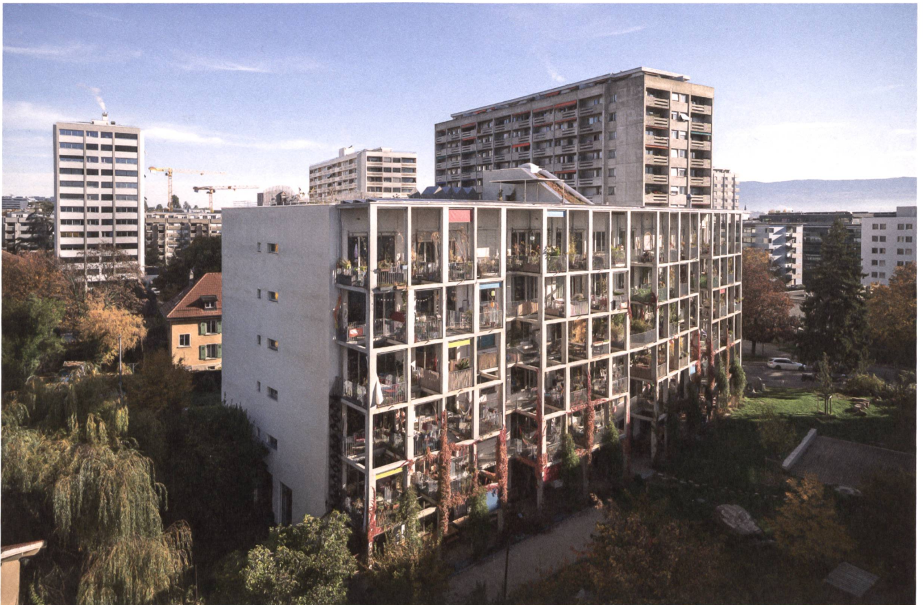
2 Ein Grosswohnhaus für 120 Personen bietet das Projekt Soubeyran der Genossenschaften Équilibre und Luciole in Genf-Servette.