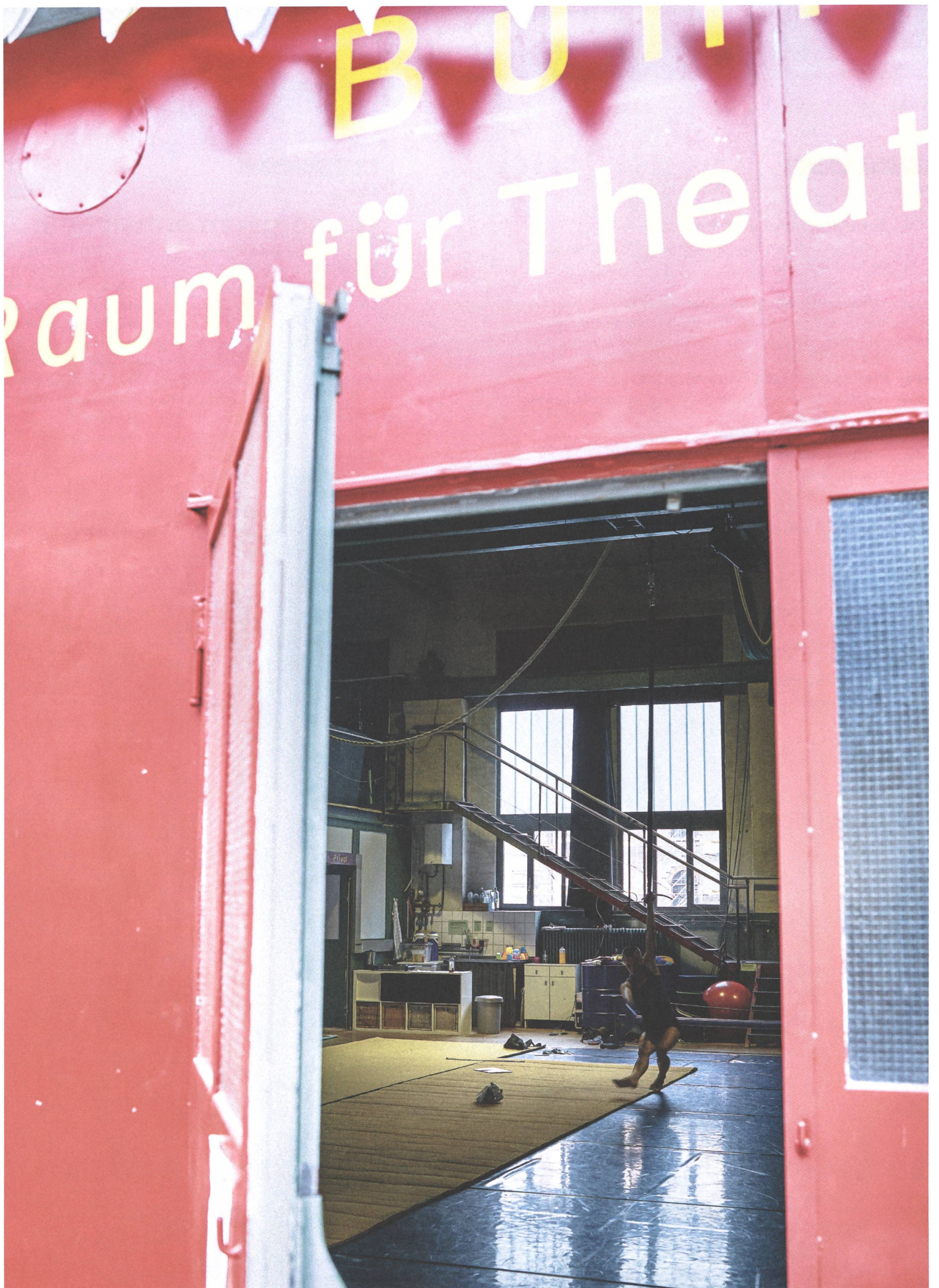
Lagerplatz Winterthur: In alten Bauten rentiert auch eine Zirkus- und Theaterschule.