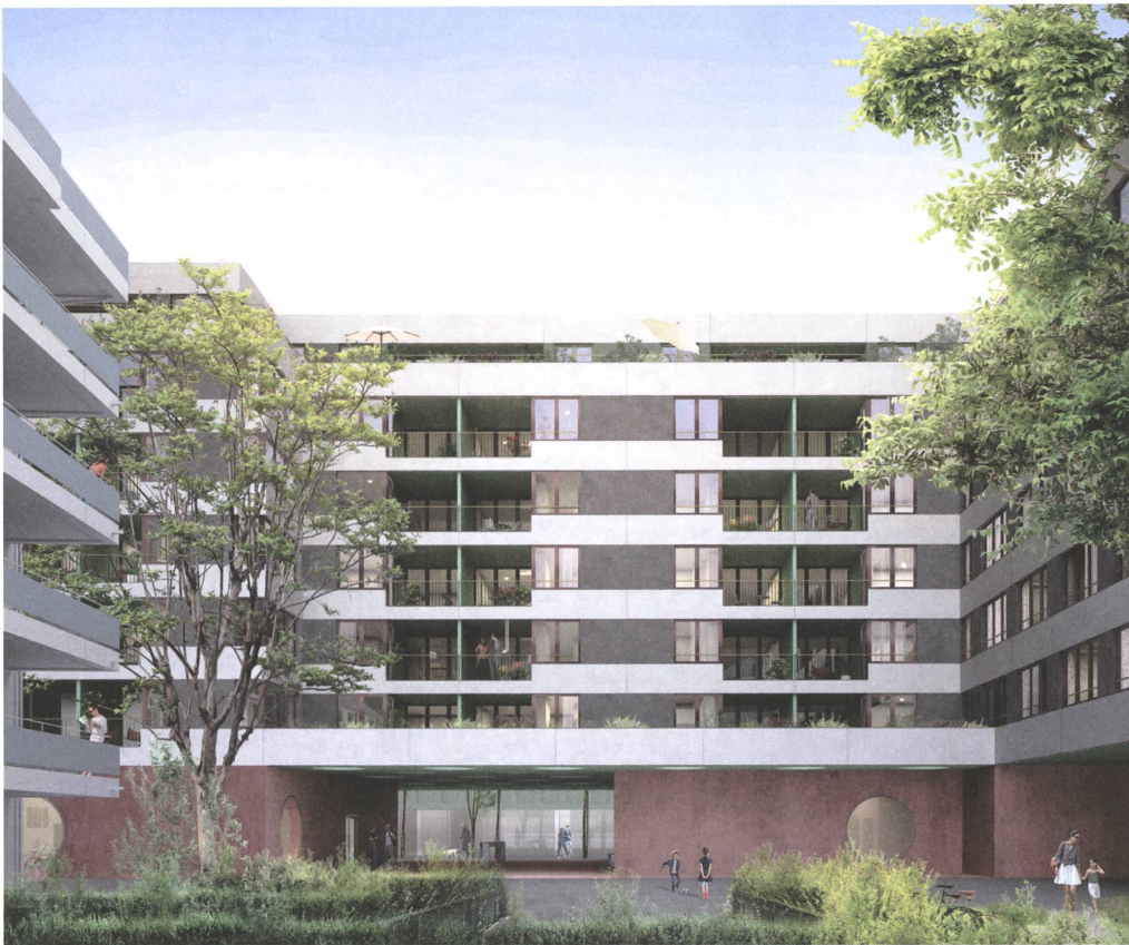
Arealentwicklung Tribtschen in Luzern von Carus St John: War die Überarbeitung notwendig?

→ erwähnte Bürogebäude ist ein weiteres Gegenüber. Entstehen sollen neu gemäss Wettbewerbsvorgabe Wohnungen mit USP (Unique Selling Proposition) sowie Verkaufsflächen und Gewerbenutzungen gegen die Strasse. Vorabklärungen zum Baugrund, zu den Grundwasserströmen, zur Parkierung und zur möglichen Etappierung liegen vor, ebenso volumetrische Studien. Die Entwickler von HRS bezeichnen die Aufgabe wegen der Lage und der gewünschten Dichte als komplex.