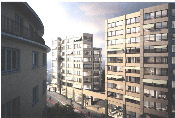
Tobler Gmür zusammen mit Steib & Geschwentner Architekten: eine Lösung für den Bundesplatz in Luzern.