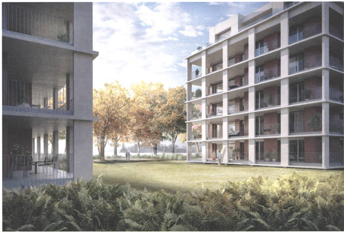
Caruso St John, Arbon: schwebende Bodenplatte auf abgesenktem Terrain.