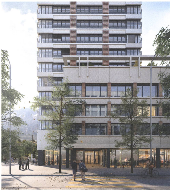
Staufers & Hasler in Buchs: Im Workshopverfahren wurde sogar eine Strasse verlegt.