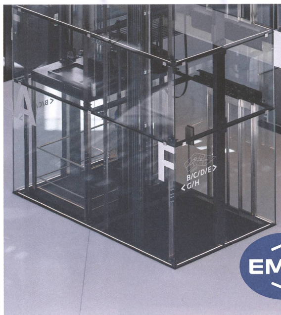
Businesspark – Ittigen Atelier 5 Architekten und Planer – Bern

Bauen Sie einen Lift, der so ist wie Sie – einzigartig.