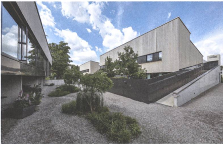
13 Meisenrain, Gockhausen, 2014.