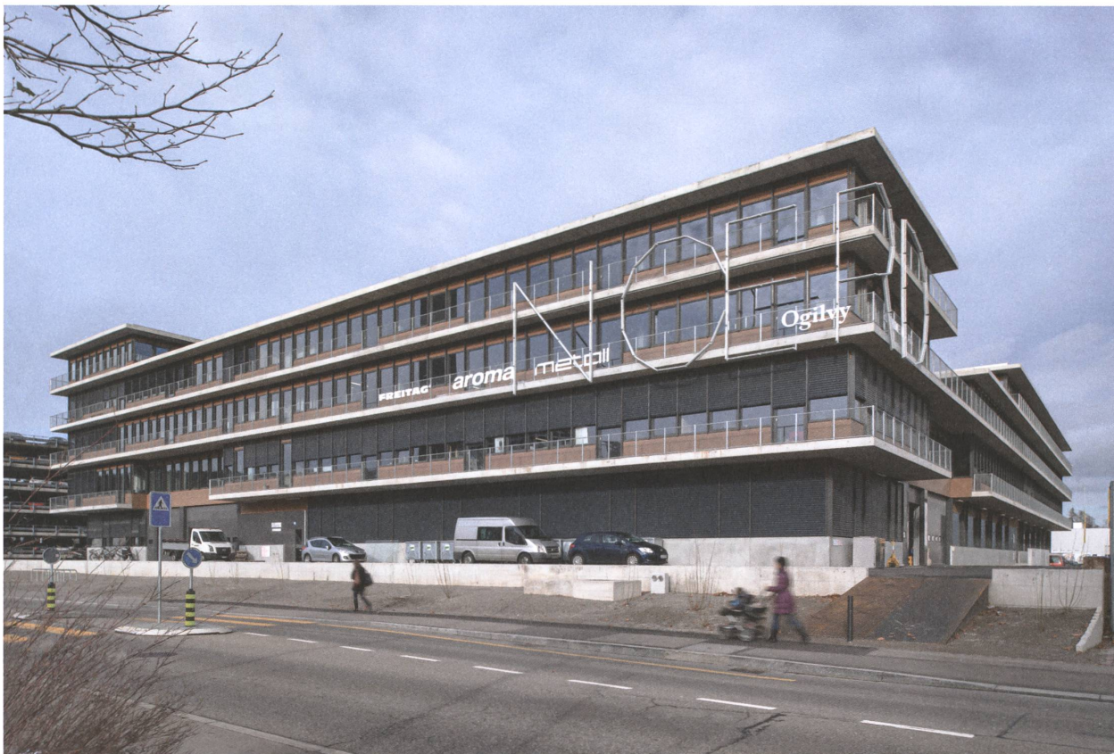
10 Nœrd, Zürich, 2011.