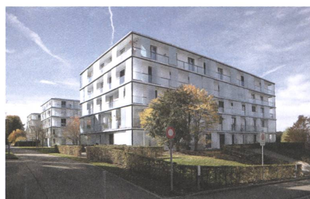
1 Achslenpark, St. Gallen, 2002.