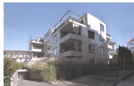
8 Guggachzehn, Zürich, 2008.

Binzmühlestrasse 170a–d, Zürich Bauherrschaft: Anlagestiftung Turidomus, Zürich Architektur: Rothen Architektur, Winterthur Nutzfläche: 18 907 m 2 Bauvolumen: 105 861 m 3 Investitionsvolumen: Fr. 53 Mio. Baubeginn: Frühling 2010 Fertigstellung: Mitte 2011 Rolle Senn: Projektentwickler, Zwischeninvestor, Totalunternehmer