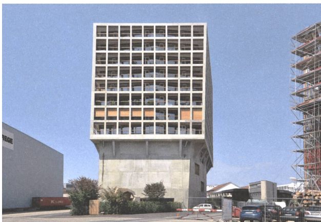
15 Helsinki, Münchenstein, 2014.