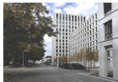
9 Wohn- und Geschäftshaus Connect, Zürich, 2010.