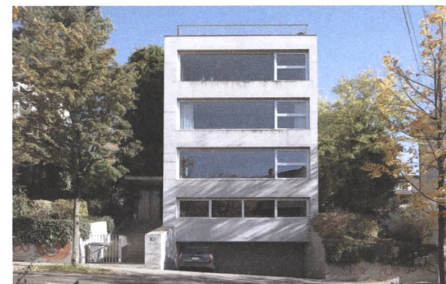
2 Blümlisalpstrasse, Zürich, 2003.