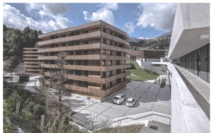
17 Stenna, Flims, 2018 / 19.