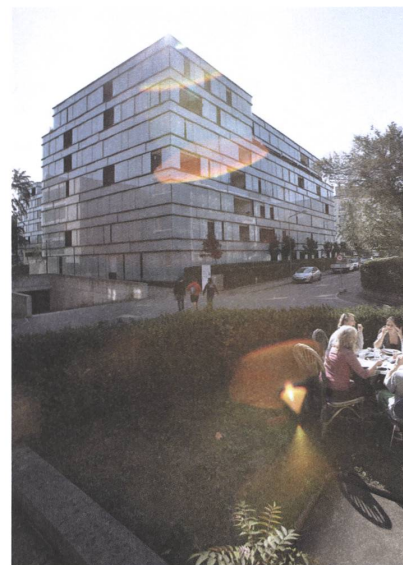
5 Wohnanlage Eichgut, Winterthur, 2005.