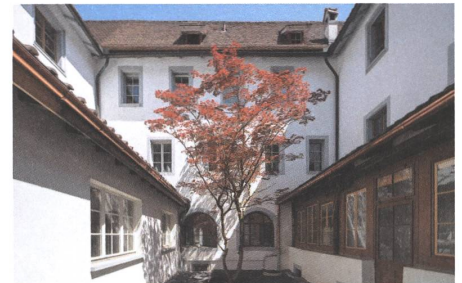
20 Kloster, Stans, 2020.