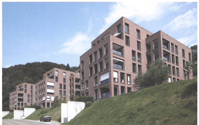
12 Rosenbüchel, St. Gallen, 2011.