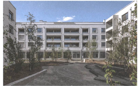
14 Fehlmannmatte, Windisch, 2014.