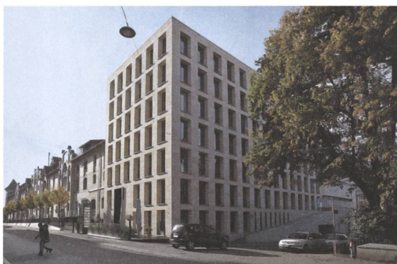
3 Davidstrasse, St. Gallen, 2004.