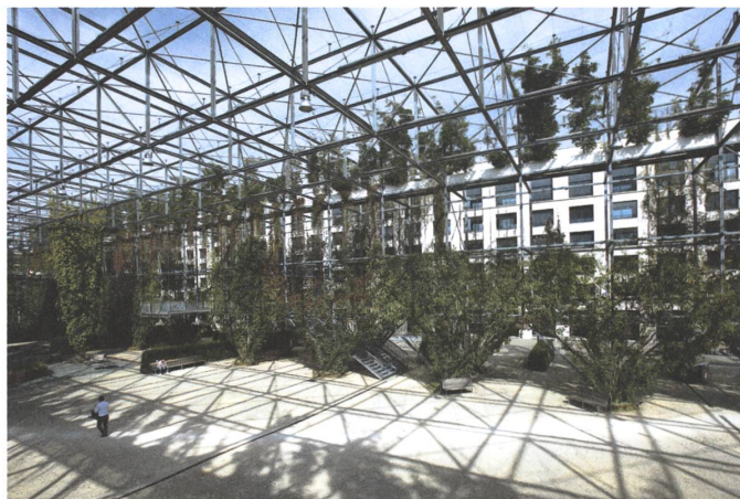
6 Ententeich, Zürich-Oerlikon, 2007.