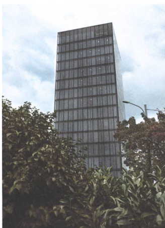
4 Bürohochhaus Obsidian, Zürich, 2004.