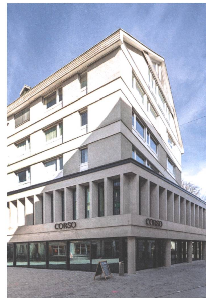
19 Corso, St. Gallen, 2020.