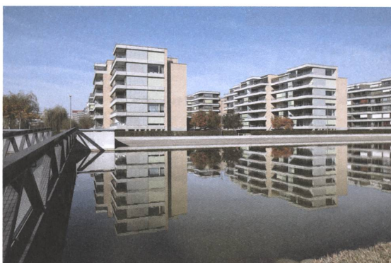
7 Glattpark, Opfikon, 2007.