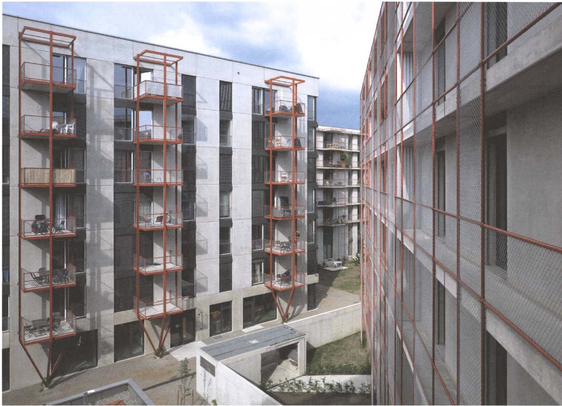
16 Zwicky Süd, Dübendorf, 2016.