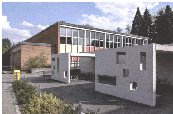
Velourstand aus der Bauzeit. Im Hintergrund die Turnhalle.