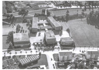
Schulanlage Wolfsmatt, Dietikon, 1969.