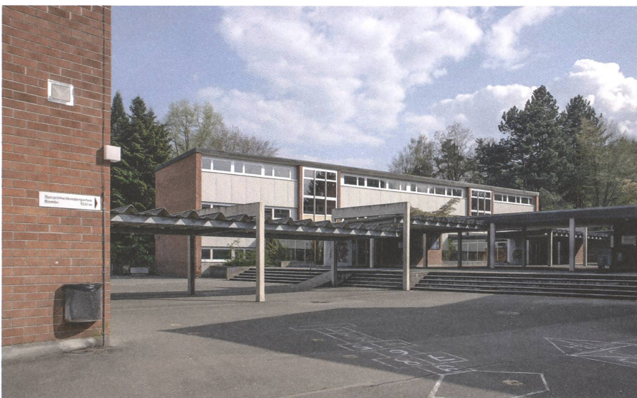
Pausenhof mit überdeckten Verbindungswegen.