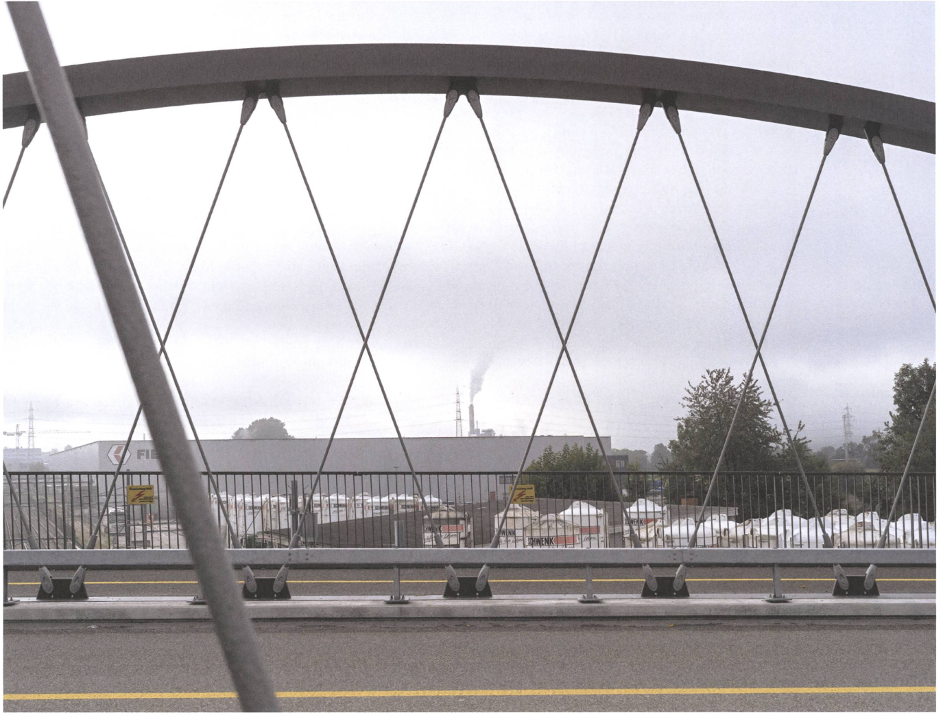
Eine Brücke schlägt den Bogen für die Hauptstrasse über die Eisenbahnlinie Olten-Luzern. Durch ihre Harfe sehen wir die Zwischennutzung eines Fabrikanten von Baustoffen und dann die grosse Kiste von Fiege – einer Logistikfirma, die die Standortgunst des Autobahnkreuzes nutzt. Im Hintergrund raucht die Kehrichtverbrennung.