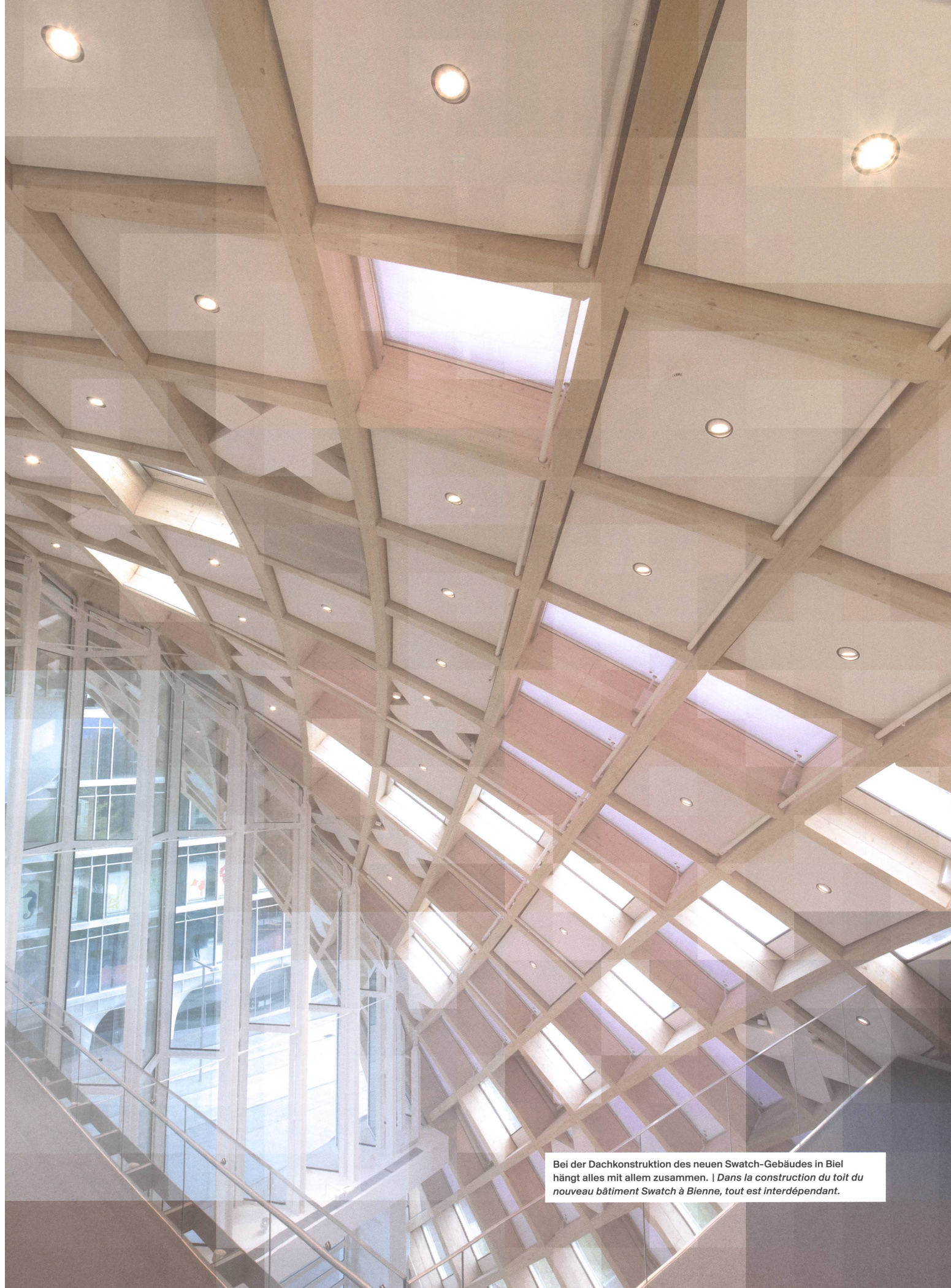
Bei der Dachkonstruktion des neuen Swatch-Gebäudes in Biel hängt alles mit allem zusammen. | Dans la construction du toit du nouveau bâtiment Swatch à Bienne, tout est interdépendant.