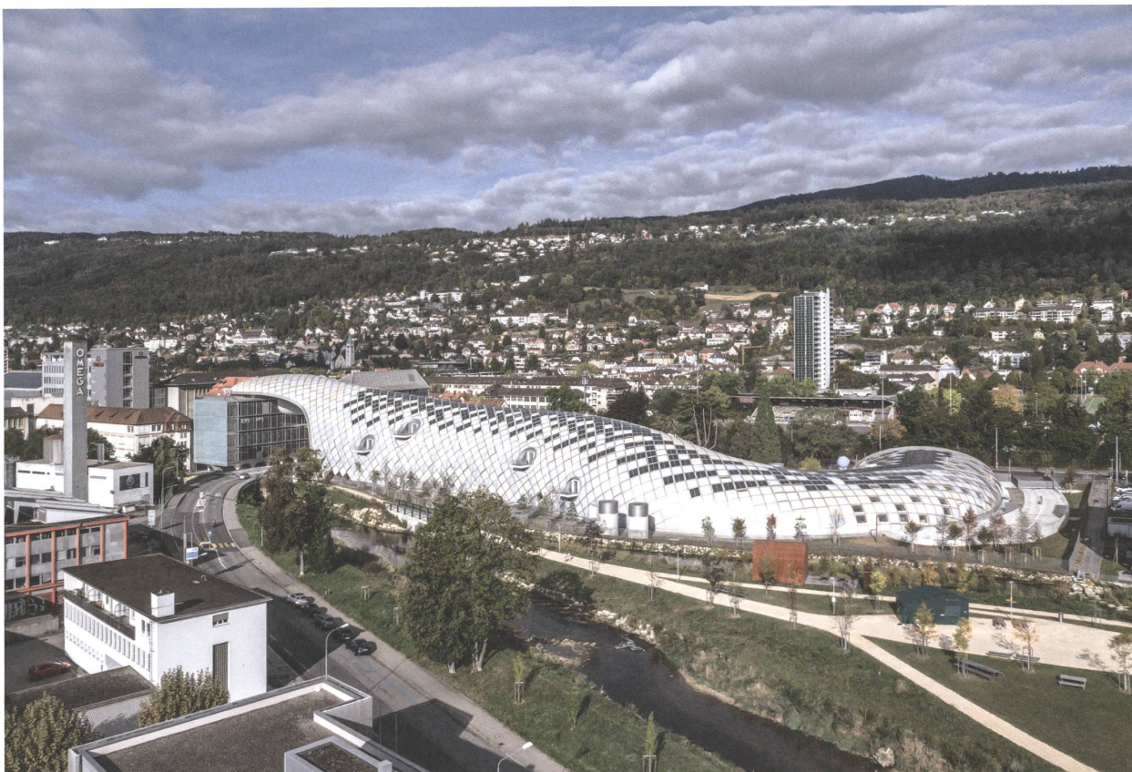
Das Gebäude windet sich 240 Meter lang vom Haupteingang bis zur Laderampe auf der rechten Seite. | Le bâtiment serpente sur une longueur de 240 mètres de l'entrée principale à la rampe de chargement à droite.