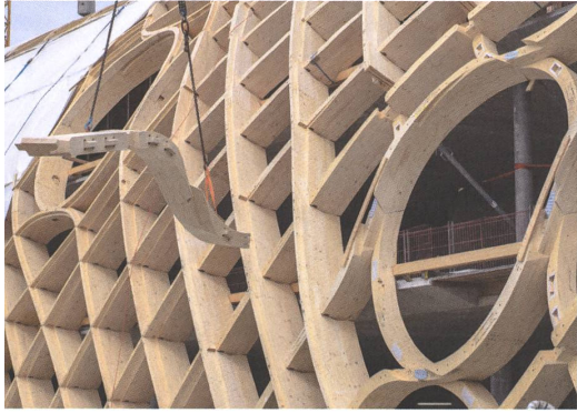
Die Holzelemente sind vielfach gekrümmt. | Les éléments en bois ont des courbures multiples.