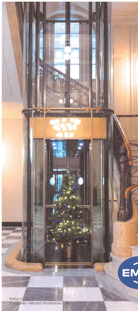
Kultur Casino Bern Campanile + Michetti Architekten - Bern

Die Klassiker von morgen. Massarbeit aus der Lift- Manufaktur.