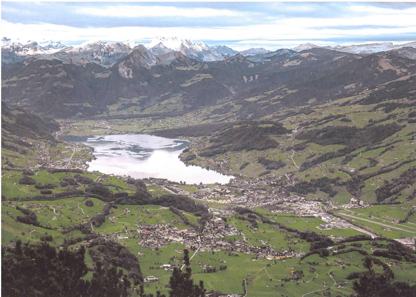
Die Hälfte der Bauten ausserhalb der Bauzone: Streusiedlungen brauchen Gestaltungsgebote. Blick auf den Sarnersee mit Sachseln (links), Kerns und Sarnen.