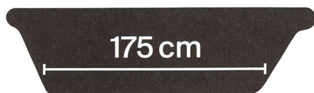
So lang ist eine Standard-Badewanne in Mietwohnungen.

Sparsame Systeme sind denn auch im Trend. Neben der vorrangigen Nachfrage nach mehr Hygiene und Wohlbefinden hat Branchenführer Geberit das seit Jahren auf dem Radar: Der Duschvorgang bei dessen Dusch-WC verbraucht im Schnitt etwa einen Liter Wasser. Das mag zunächst irritieren, wird aber in den versteckten Zahlen der Trockenreißkultur deutlich: Die Produktion von WC-Papier verschlingt grosse Wassermengen: 280 Liter werden für die Herstellung von einem Kilogramm Toilettenpapier benötigt. Die Toilette der Zukunft könnte ganz ohne Wasser auskommen. Die Vorlage dazu lieferten Forscher der ETH-Wasserforschungsanstalt Eawag vor sieben Jahren. Das Produkt wird aber kaum in Schweizer Badezimmern stehen, sondern in Entwicklungsländern – Microsoft-Gründer Bill Gates will damit die sanitären Bedingungen von fast drei Milliarden Menschen verbessern. ●