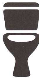
So viel kostet die teuerste Toilette der Welt, verbaut in der ISS-Raumstation.