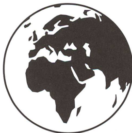
1,4 Milliarden Kubikkilometer Wasser gibt es auf der Erde.