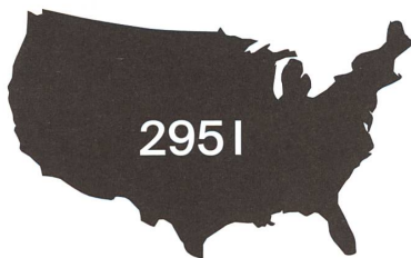
Bei 295 Litern pro Tag liegt der Pro-Kopf-Wasserverbrauch in den USA.

Hergestellt werden die Dusch-WCs in Rapperswil-Jona. Die Keramik stammt aus einem Geberit-Werk in Deutschland, die Technik aber wird am Zürichsee verbaut. Der Konzern hat die arbeitsintensiven Schritte 2012 am Hauptsitz gebündelt und so achtzig Stellen geschaffen. Trotz aufgewertetem Franken sind die Jobs bis heute in der Schweiz geblieben. Drei Werke betreibt das Unternehmen hierzulande, zwei in Rapperswil-Jona und eines im freiburgischen Givisiez, wo Teile der Rohrleitungssysteme fabriziert werden. Der Grad der Automatisierung ist hoch, etwa bei den sogenannten Betätigungsplatten, dem Geberit-Klassiker. Diese sind mit dem Spülkasten verbunden, der heutzutage meistens in einer Trockenwand verbaut ist.