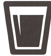
0,0001 Prozent des Wassers auf der Erde ist leicht zugängliches Süsswasser.