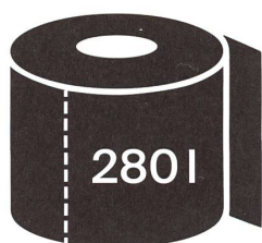
So viel Wasser braucht es für die Herstellung von 1 Kilogramm Toilettenpapier.