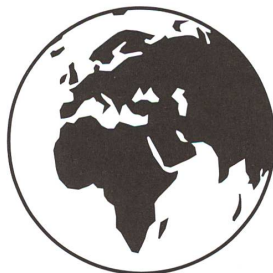
1,4 Milliarden Kubikmeter Wasser gibt es auf der Erde.