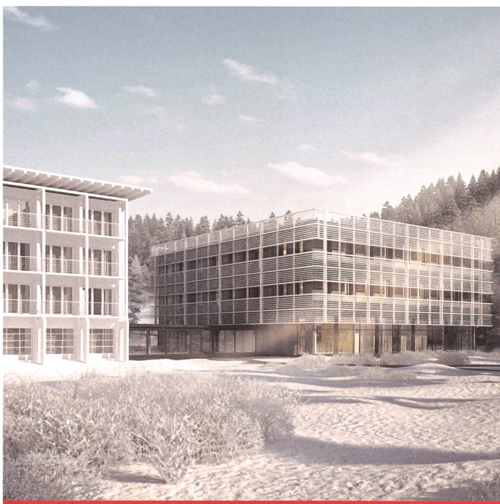
DAVOS Campusgebäude Davos-Wolfgang