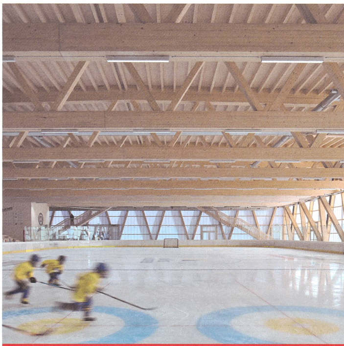
DAVOS Trainingshalle HCD Davos