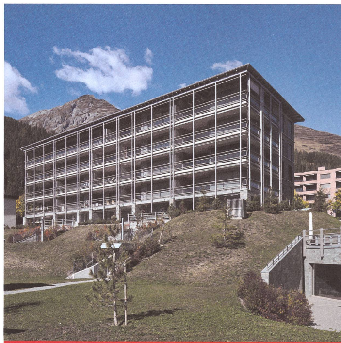
DAVOS Symondpark Davos Platz