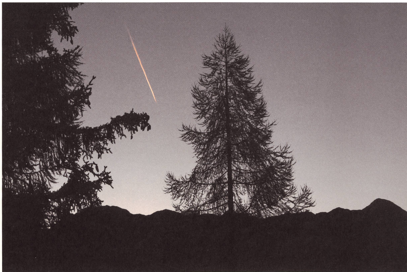
Morgenstimmung Strela- alpstrasse, Schatzalp Davos.