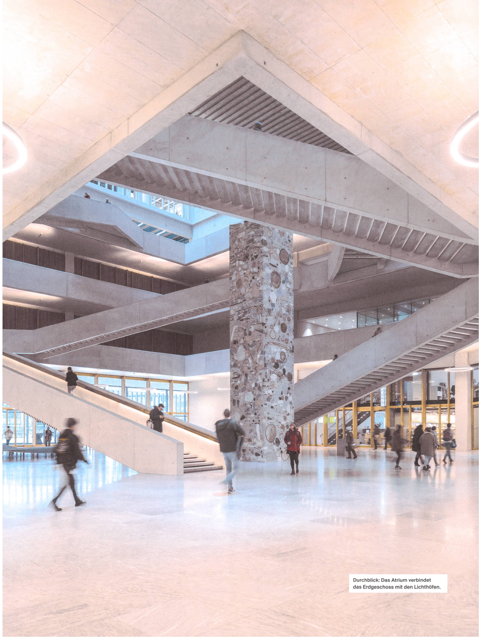
Durchblick: Das Atrium verbindet das Erdgeschoss mit den Lichthöfen.