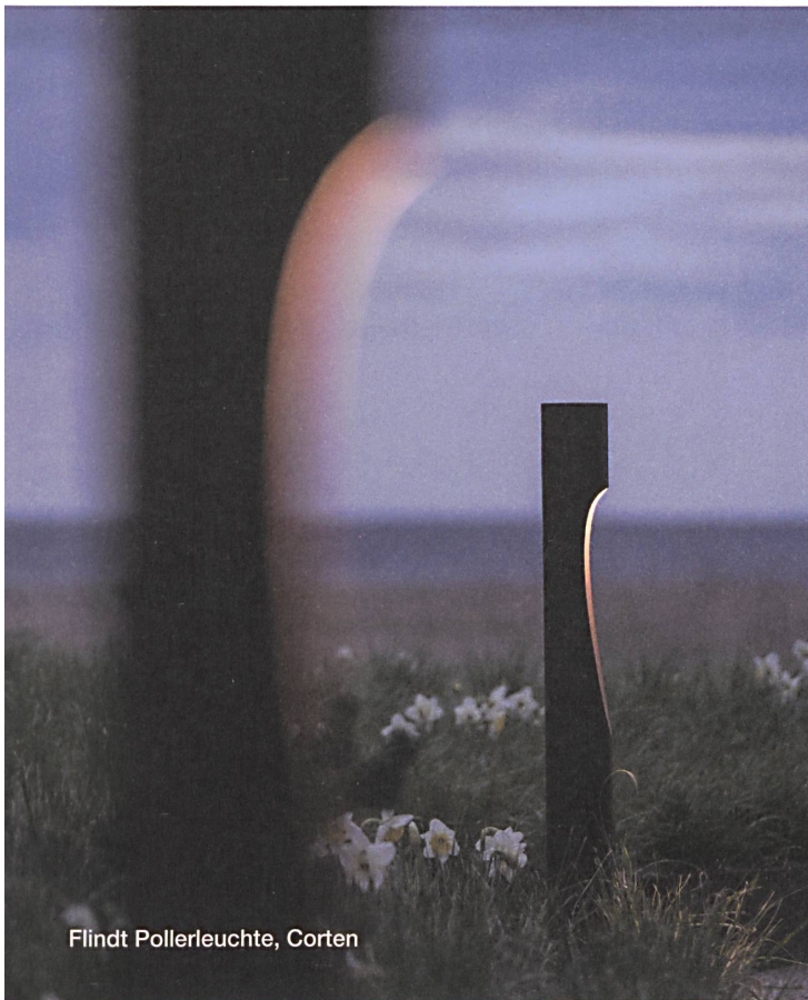
Flindt Pollerleuchte, Corten