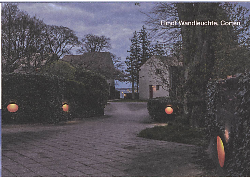
Flindt Wandleuchte, Corten