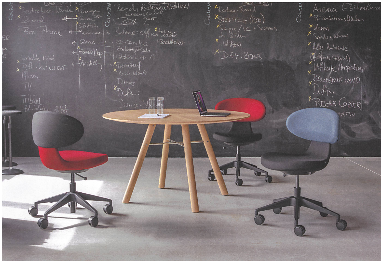
Simplex 3D. Drehstuhl mit dreidimensionaler Beweglichkeit – multifunktional und universell einsetzbar. Design: Greutmann Bolzern