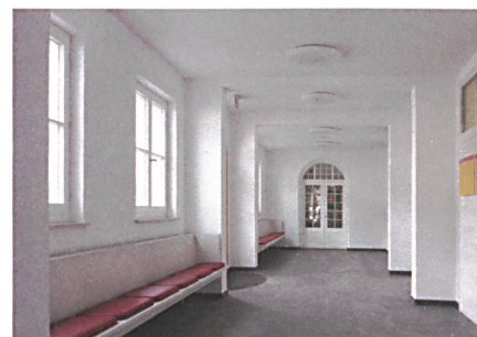
Ausgeräumt, licht und luftig – das Interieur der Station mit den Sitzbänken, die in die Architektur gefügt wurden.