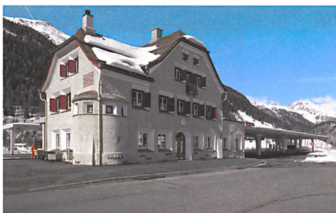
Burg bleibt Burg – der stolze Bahnhof von Zernez mit Bogenhalle und Umsteigeplatz auf die Busse nach Südtirol (rechts).