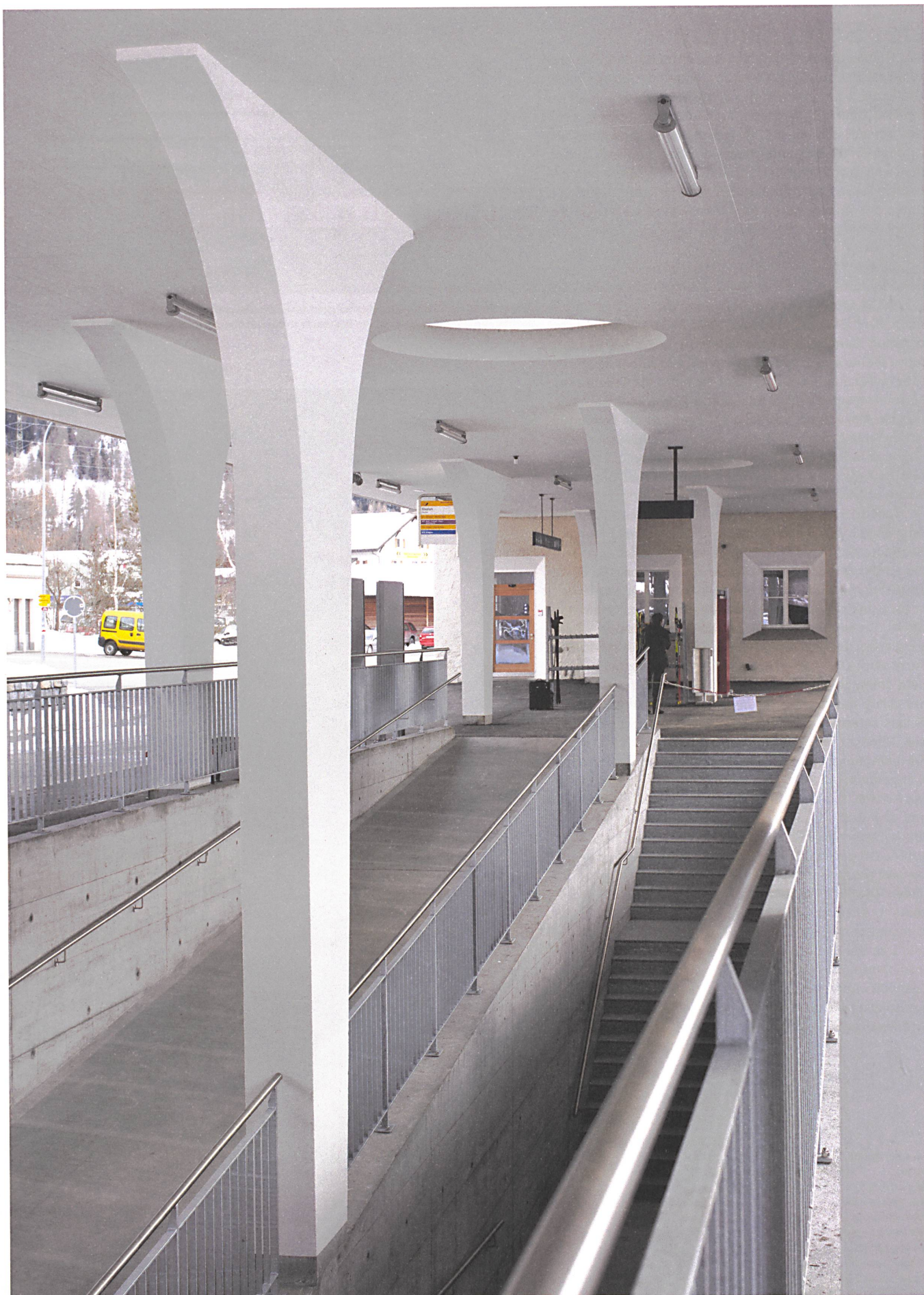
Eisenbahn für alle heisst Zugang für alle über lange Rampen und Unterführungen.