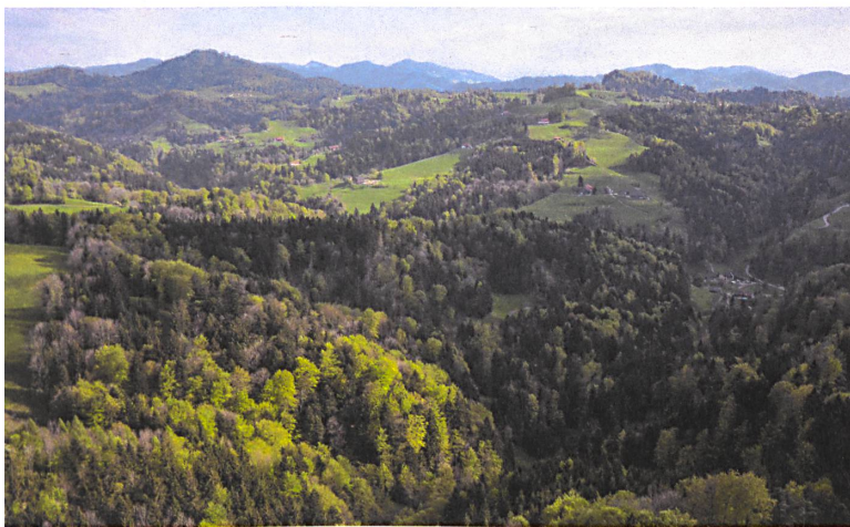
Das Steinenbachtobel bei Kaltbrunn im Kanton St. Gallen. | Le ravin du Steinenbach près de Kaltbrunn dans le canton de Saint-Gall. | L'angusta valle dello Steinenbach presso Kaltbrunn, nel Canton San Gallo.

«Una visione futura coerente del paesaggio»: era questa la richiesta. Coerente significa senza contraddizioni: un requisito tutt'altro che facile da soddisfare per un progetto da realizzare in tre cantoni e 74 comuni. Un'analisi approfondita ha identificato 14 unità paesaggistiche e quattro tipi di paesaggio principali. Partendo da quest'analisi, la visione futura è stata sviluppata nei laboratori partecipativi: quali sono le caratteristiche da rafforzare, quali le carenze a cui ovviare? Di cosa abbiamo bisogno, di cosa ha bisogno la natura? Oltre alla visione del futuro, nei testi e nei progetti odierni c'è anche una matrice con orientamenti e campi d'intervento, nonché i primi progetti consigliati, ad esempio «Gli spazi verdi curati della Svizzera orientale». La visione futura si basa sul programma d'agglomerato di terza generazione e sui contributi per la qualità del paesaggio. Integra strumenti e attori negli insediamenti, nel traffico, nelle foreste e nell'agricoltura con un approccio intercomunale e intercantonale. Se questa idea fiorirà, il concetto di «coerenza» potrà essere realizzato.