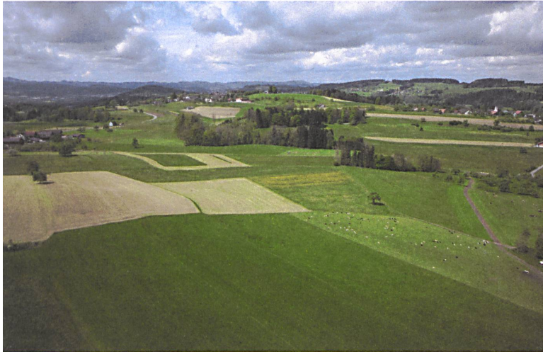
Bei Wuppenau östlich des Nollen im Kanton Thurgau. | Près de Wuppenau à l'est du Nollen en Thurgovie. | Vicino a Wuppenau, a est del Nollen, nel Canton Turgovia.

«Une vision cohérente de l'avenir du paysage» était exigée. Pas une tâche facile pour un projet à cheval sur trois cantons et 74 communes de la région du lac de Constance. Une analyse approfondie a identifié quatorze unités paysagères réparties en quatre grands types. Sur cette base, une vision a été élaborée dans le cadre d'ateliers participatifs. Quelles caractéristiques renforcer, quels manques combler? De quoi avons-nous besoin, de quoi la nature a-t-elle besoin? La vision sous forme de textes et de plans s'accompagne d'une matrice comprenant des axes prioritaires et des champs d'action ainsi que des premières recommandations, notamment sur la création d'espaces verts de délasserment. Elle sert de base au projet d'agglomération de 3 e génération et aux contributions à la qualité du paysage. Fédérant différents instruments et acteurs liés au paysage (habitat, transports, forêt et agriculture), elle permet de tirer à une même corde par-delà les frontières communales et cantonales.