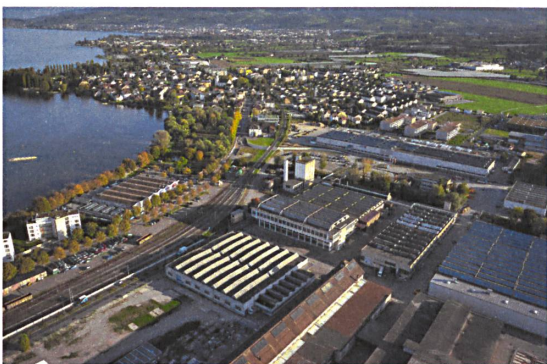
Arbon am Bodensee. | Arbon au bord du lac de Constance. | Arbon sul lago di Costanza.

Zwar ist eine intakte Landschaft zunehmend ein Anliegen der Raumplanung, und Analysen und Leitbilder werden häufig hergestellt. Aber selten gelingt es, ihr dabei die Hoheit einzuräumen: Landschaft ist das Ganze und nicht das, was neben Dörfern und Städten übrig bleibt. Da nützen Worte nichts, es braucht Taten. Im vorliegenden Projekt sind das die mit finanziellen Anreizen verbundenen Planungswerkzeuge «Agglomerationsprogramm der 3. Generation» und «Landschaftsqualitätsbeiträge», denen das Zukunftsbild zugrunde gelegt wurde. So bündelt es Instrumente und Akteure in Siedlung, Verkehr, Wald und Landwirtschaft. So können alle, die an und in der Landschaft arbeiten, am selben Strick ziehen über Gemeinde- und Kantonsgrenzen hinweg. Beginnt das zu blühen, ist das «konsistent» gerechtfertigt.