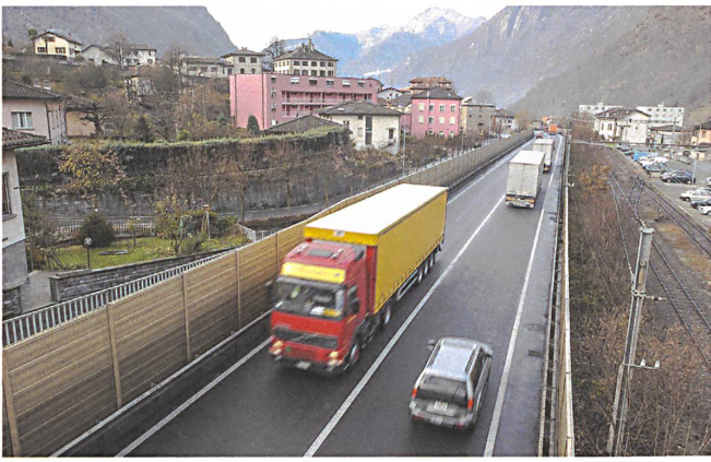
Fünfzig Jahre Alptraum – die A13 führte mitten durch Roveredo.