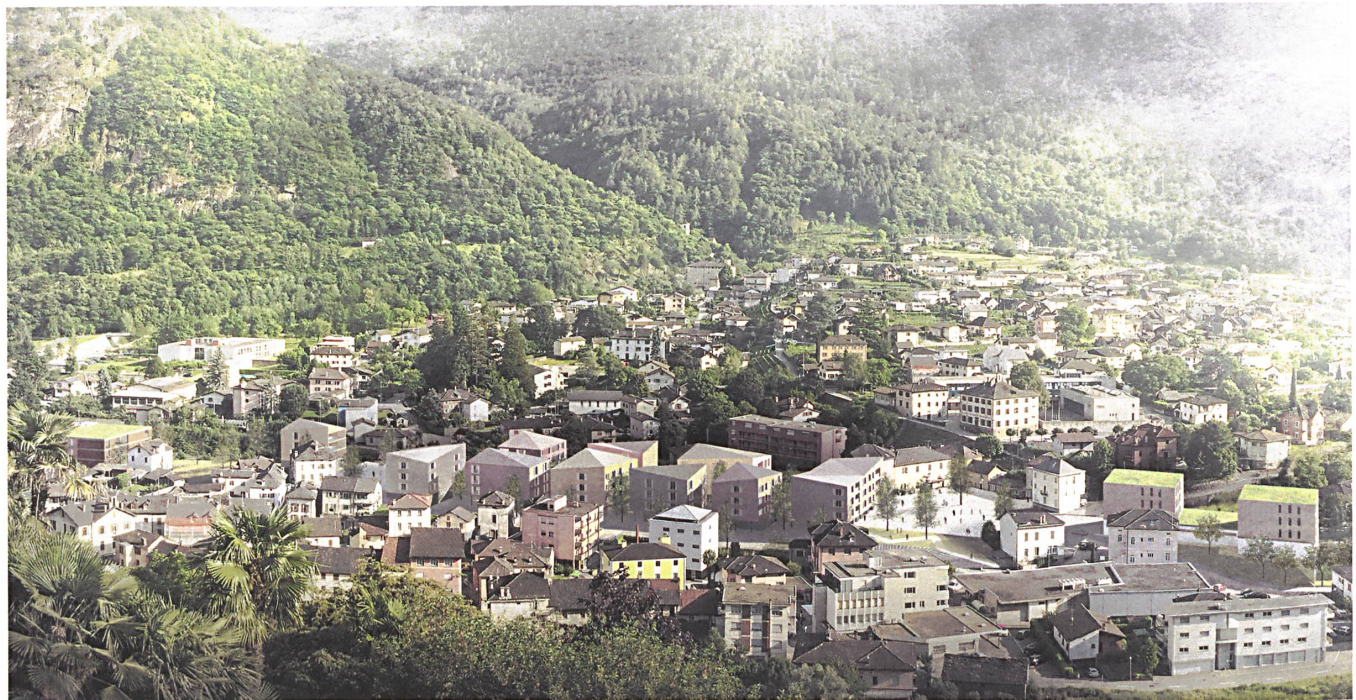
Das Reparaturvorhaben für Roveredo im Rendering der Investorin Alfred Müller AG, die zusammen mit Architekten und Landschaftsarchitekten den Wettbewerb gewonnen hat.