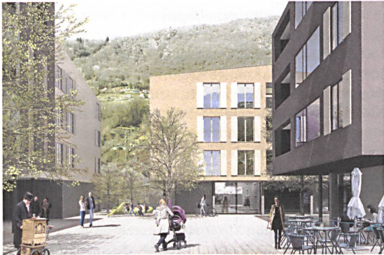
So soll Roveredos neue Mitte werden.