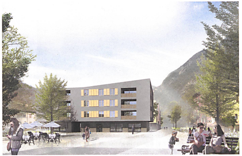
Wohnraum, Strassenraum und öffentlicher Raum laufen ineinander. Visualisierungen: Alfred Müller AG