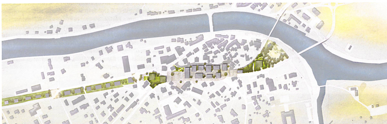
Roveredo Viva – die A13 ist unter der Erde, auf ihrer Brache zieht ein Parkband durch das Dorf. Doch die fast hundert Wohnungen und Läden in zwölf Häusern wecken Widerstand: Eine Gruppe von Petitionären will kein «seelenloses Aggloquartier».