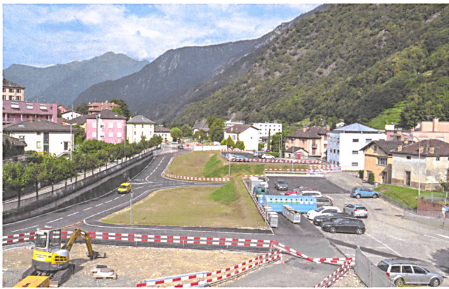
Seit die Autobahn in Roveredo rückgebaut ist, werden die Dimensionen des Leerraums sichtbar. Kritiker der geplanten Überbauung fordern mehr Grünfläche.

→ nichts zu sagen. Die Wunde wurde geschlagen, der Dorfplatz Al Sant, auf dem fast alle Gassen zusammenlaufen, verschwand unter dem Beton.