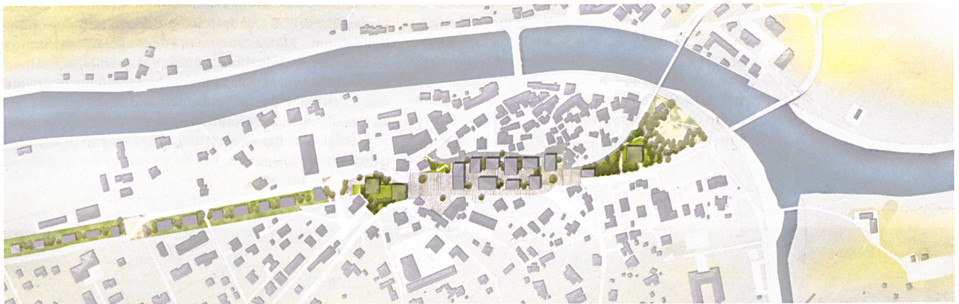
Roveredo Viva – die A13 ist unter der Erde, auf ihrer Brache zieht ein Parkband durch das Dorf. Doch die fast hundert Wohnungen und Läden in zwölf Häusern wecken Widerstand: Eine Gruppe von Petitionären will kein «seelenloses Aggloquartier».