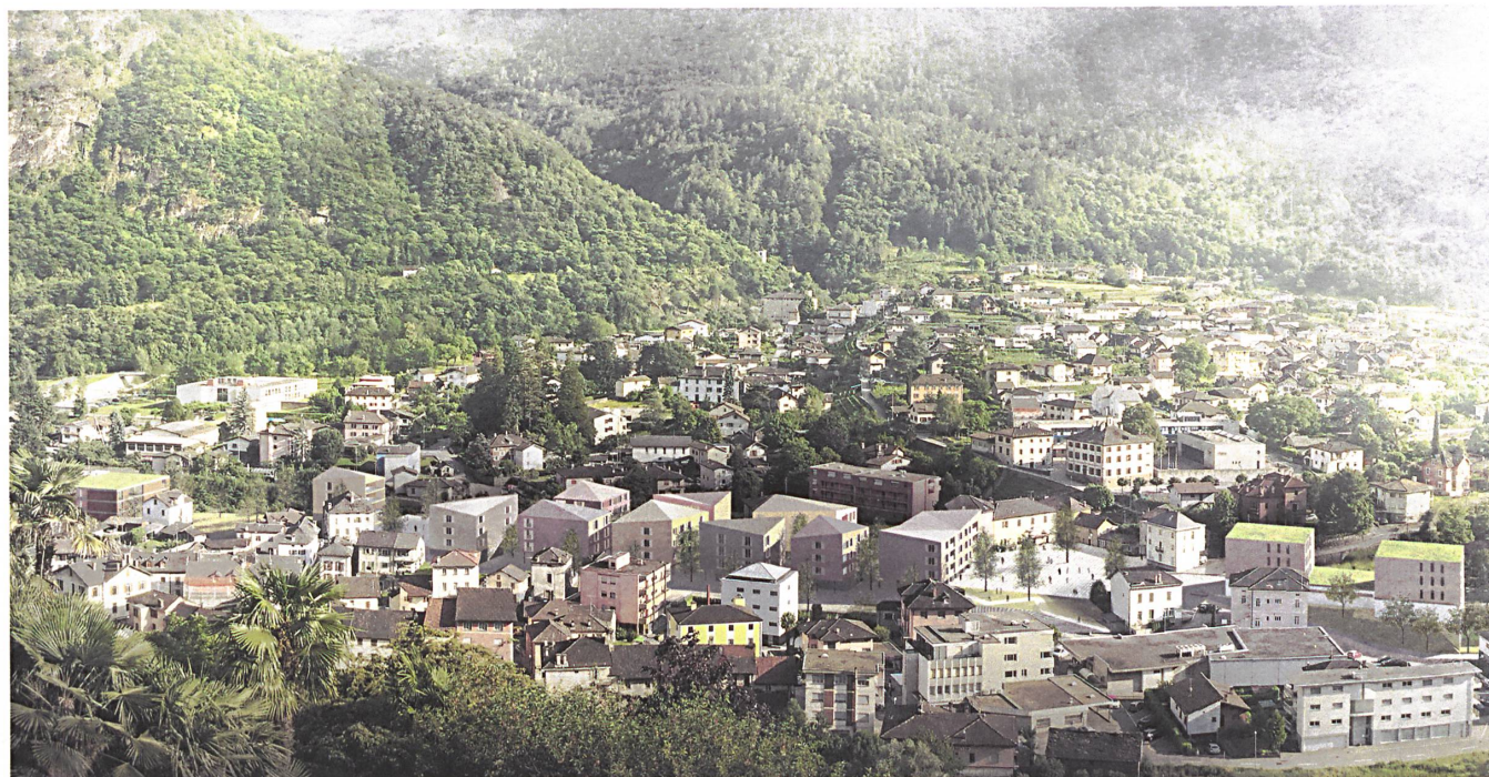
Das Reparaturvorhaben für Roveredo im Rendering der Investorin Alfred Müller AG, die zusammen mit Architekten und Landschaftsarchitekten den Wettbewerb gewonnen hat.