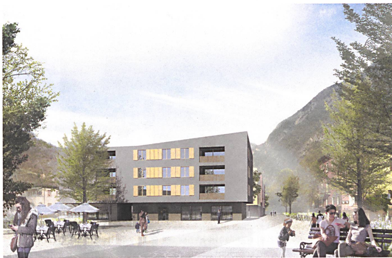
Wohnraum, Strassenraum und öffentlicher Raum laufen ineinander. Visualisierungen: Alfred Müller AG