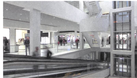
7 Erweiterung Einkaufszentrum, 2014