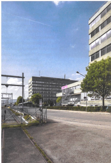
15 Areal Bahnhof Nord, 2040