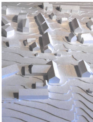
18 Arealüberbauung Gheidstrasse, in Planung