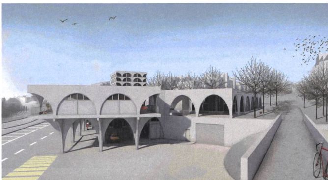
13 Sanierung und Erweiterung Zentrum Sonnenhalde, in Planung Visualisierung: Knapkiewicz & Fickert