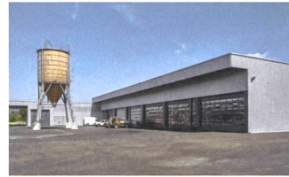
4 Werkhof, 2016