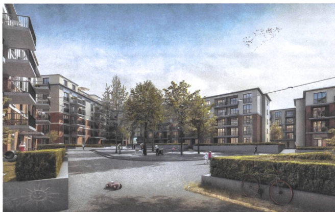
17 Wohnüberbauung Stockenhof, 2022