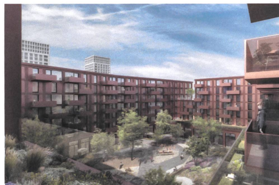
19 Wohn- und Gewerbehäuser Althardstrasse, 2021