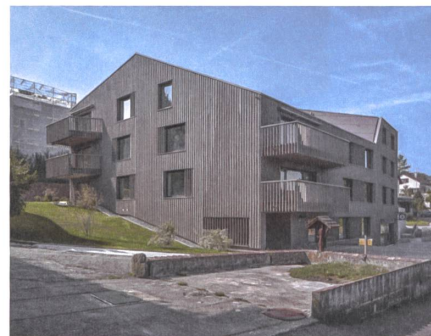
1 Wohnüberbauung Sagi, 2016

Das Projekt für das 36 000 Quadratmeter grosse Areal umfasst mehr als 600 Wohnungen. Es sieht aufgebrochene Blockränder vor, aus denen zwei Hochhäuser wachsen. Insgesamt sollen in zwei Etappen fast 70 000 Quadratmeter Wohn-, Dienstleistungs- und Gewerbeflächen entstehen. Adresse: Althardstrasse / Neuhardstrasse / Wehntalerstrasse Bauherrschaft: Pensimo Gruppe, Zürich Richtprojekt: ADP Architekten, Zürich Auftragsart: eingeladener Wettbewerb, 2014 (durchgeführt von vormaliger Eigentümerin)