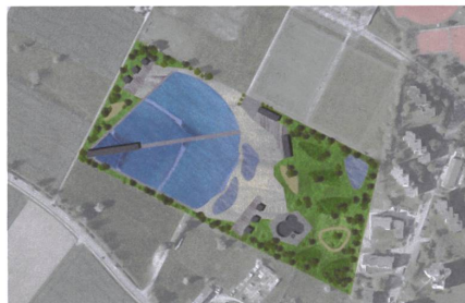
16 Waveup, 2020 Plan: Waveup / Carint Berke Architekten