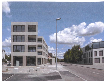
12 Neubau Bibliothek und Wohnungen, 2017