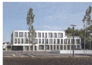
5 Erweiterung Gemeindehaus, 2016