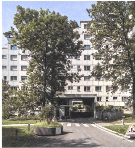
3 Erneuerung Sonnenhalde, 2016 und 2018