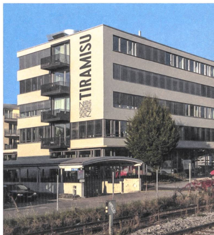
10 Wohn- und Geschäftshaus Tiramisu, 2015