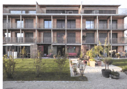
8 Wohnsiedlung Sunny Watt, 2010