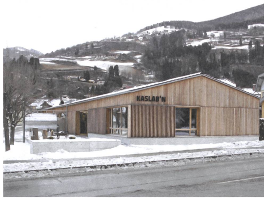
Die grossen Fenster schaffen Öffentlichkeit. | The big windows provide visibility.

25 Schaukäserei Kaslab'n | Show dairy Kaslab'n, 2016 2. Preis | 2 nd prize, € 10 000 Mirnockstrasse 19, A-Radenthein Bauherrschaft | Principals: Genossenschaft Kaslab'n Nockberge, A-Radenthein Architektur | Architecture: Hohengasser Wirnsberger Architekten, A-Spittal an der Drau Statik Massivbau | Structural analysis: Urban & Glatz Ziviltechniker- gesellschaft, A-Spittal an der Drau Statik und Planung Holzbau | Statics and planning timber construction: Tschabitscher, A-Steinfeld Baukosten | Building costs: € 2.1 Mio. Energiekennzahl | Energy key: 58 kWh / m 2 a