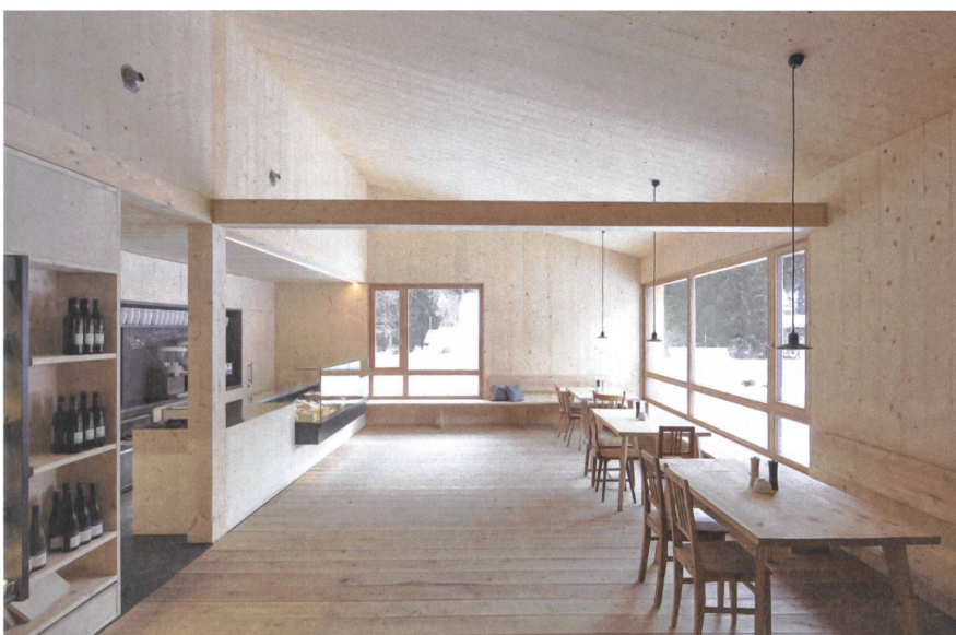
Der Verkaufsraum ist auch Ess- und Aufenthaltszimmer. | The shop is also a room to eat and spend time in.