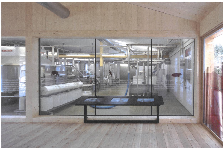
Besucher erhalten Einblick in die Käseproduktion. | Visitors gain insight into cheese production.