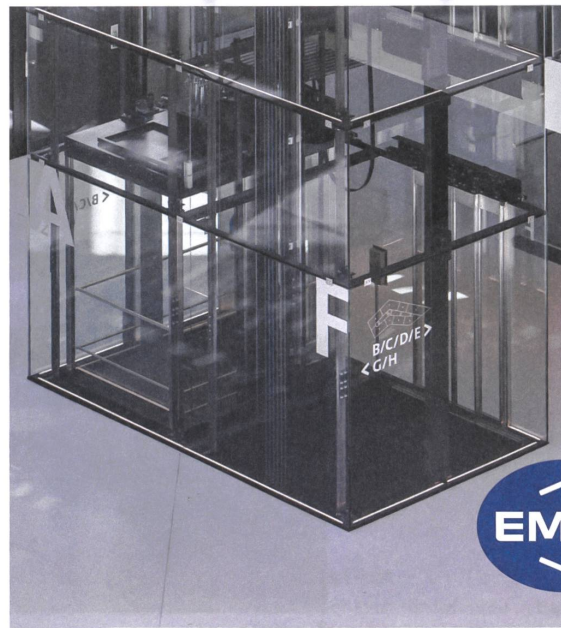
Businesspark – Ittigen Atelier 5 Architekten und Planer – Bern

Bauen Sie einen Lift, der so ist wie Sie – einzigartig.