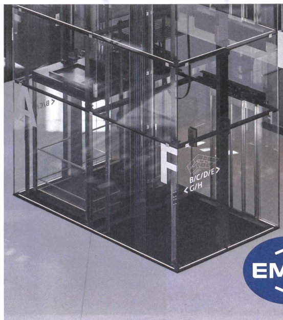
Businesspark – Ittigen Atelier 5 Architekten und Planer – Bern

Bauen Sie einen Lift, der so ist wie Sie – einzigartig.