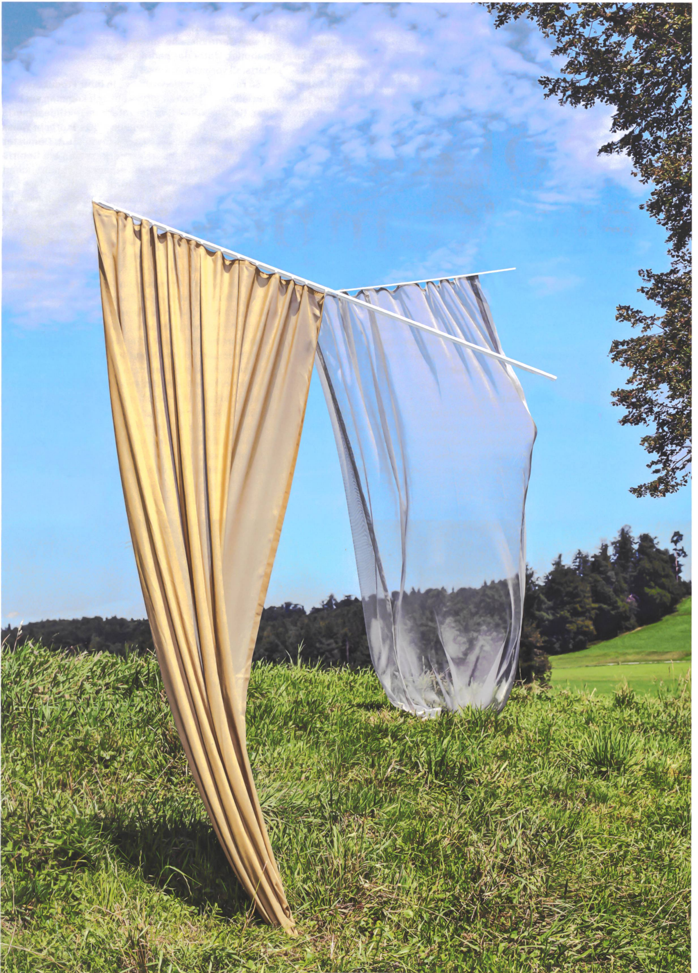
Halbtransparent und Gittertüll: zwei biologisch abbaubare Vorhänge aus Pfisters Kollektion.