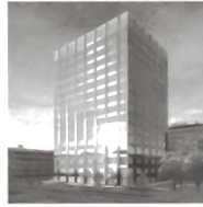
Biozentrum Universität Basel