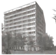
Inselspital BB6.1 Bern