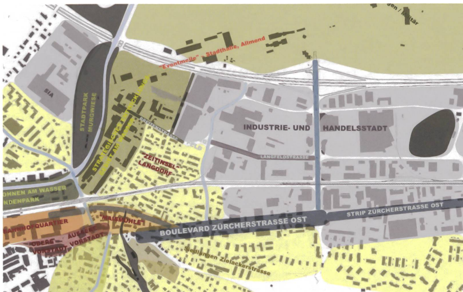
Szenenplan, Ausschnitt Langdorf.

Entwicklung Langdorf, Siedlungs- und Verkehrskonzept, 2013 Auftraggeber: Stadt Frauenfeld Planungsteam: Stauffer & Hasler Architekten, Frauenfeld; ERR Raumplaner, St. Gallen; Büro Widmer, Beratende Ingenieure für Verkehr, Umwelt, GIS, Frauenfeld