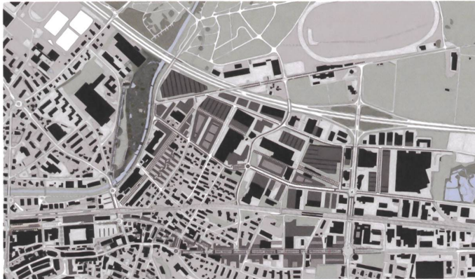
Masterplan, Ausschnitt Langdorf.