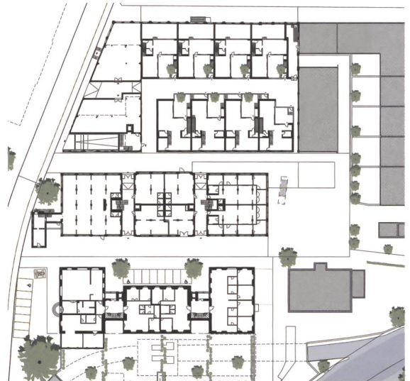
3 Überbauung Walzmühle, Grundriss Erdgeschoss.

bildet die Militärstrasse, die sich mit der Haubitzenstrasse kreuzt und dort einen zentralen Platz ausbildet. Daran liegen das bestehende ovale Kommandogebäude, das aufgestockt wird, und ein neues, liches Versorgungszentrum, das an die Stelle des bisherigen tritt. Ein medizinisches Zentrum und zusätzliche Unterkunftsgebäude ergänzen die bestehenden Versorgungsbauten östlich der Quartierachse. Westlich davon befinden sich die Ausbildungshallen, das Lagergebäude und ein Werkhof.