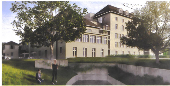
3 Überbauung Walzmühle, Antonioli + Huber + Partner.