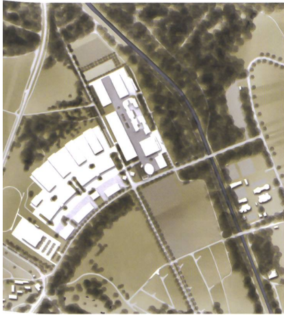
2 Mischnutzung Kaserne Auenfeld.