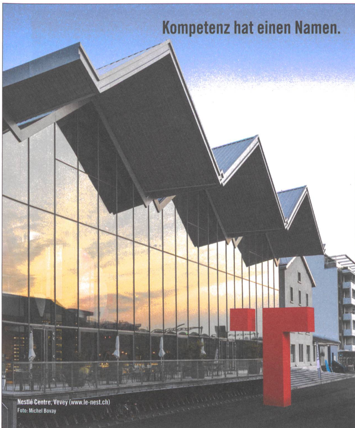
Nestlé Centre: Vevey (www.le-nest.ch)