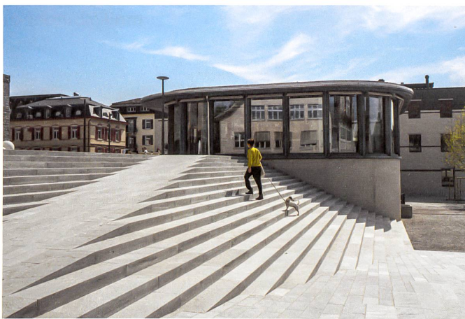
Elegante Niveauverbindung: Eine weite Treppe mit Rampe verbindet den Stadtplatz mit dem Schulhausplatz. Als Scharnier dient der Cafépavillon.