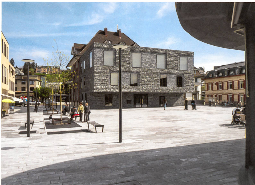
Steinernes Meilen: Der Augengneis am Boden ist gespalten, jetgestrahlt und geflammt.

Dorfplatz, Meilen ZH Bauherrschaft: Gemeinde Meilen Auftragsart: Wettbewerb, 2010 Landschaftsarchitektur: Studio Vulkan, Zürich Architektur: Blättler Dafflon, Zürich; Horisberger Wagen, Zürich Baukosten Gesamtprojekt: Fr. 33 Mio.