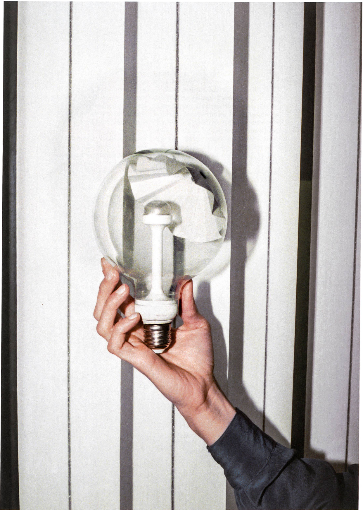
Normgewinde und Glaskolben sind Standardprodukte, die restlichen Teile der Leuchte «E27» hat der Designer Patrick Zulauf selbst entwickelt.