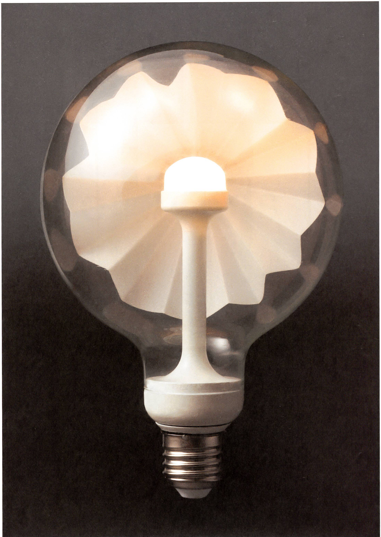
Die Gewebestruktur des Lampenschirmchens verleiht dem LED-Licht einen warmen Ton unter 2700 Kelvin und eine schon fast ornamentale Qualität.