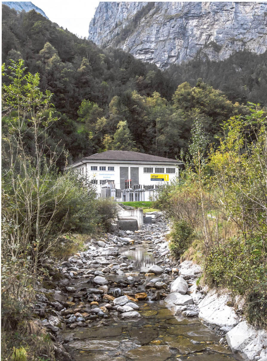
Die Turbinen in der Zentrale Ripshausen der Gemeindewerke Erstfeld liefern übers Jahr gerechnet mehr Strom, als die «Energistadt» selbst verbraucht.