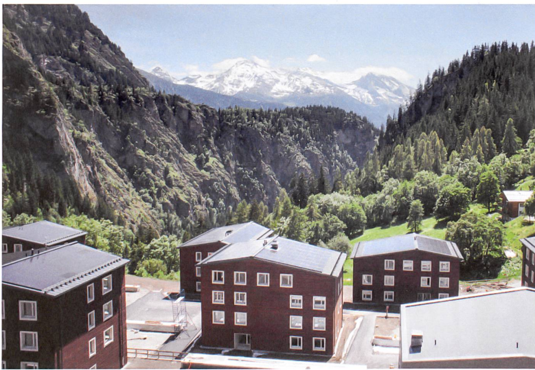
Sonne, Erdspeicher und Abwasserwärme liefern für die fünfzig Wohnungen und das Hallenbad der Reka-Siedlung in Blatten achtzig Prozent der Energie. Projekt: Lauber Iwisa