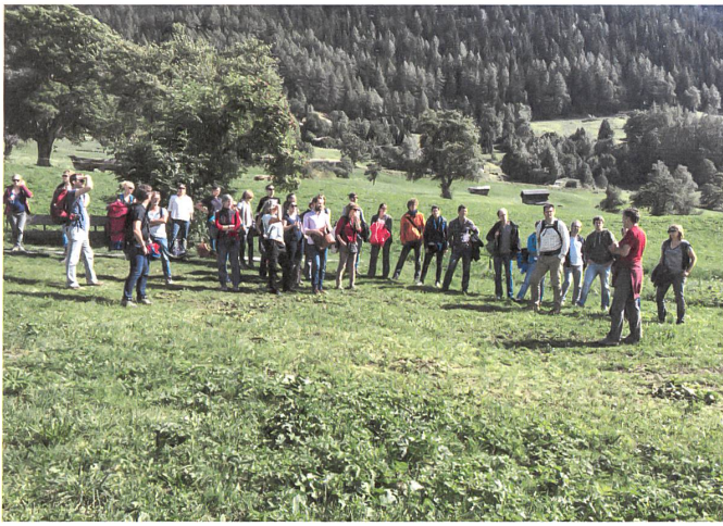
Energieexkursionen im Goms werden immer beliebter.