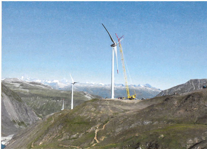
Bau des Windkraftwerks auf dem Gries.