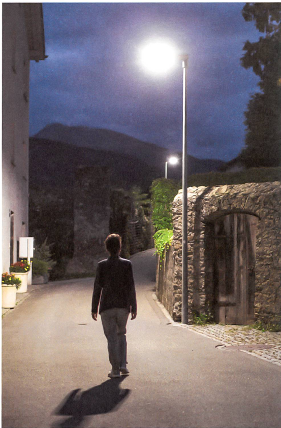
Landquart hat als erste Gemeinde die Strassenbeleuchtung mit LED bestückt. Projekt: Leo Solution; Elektro Wildhaber