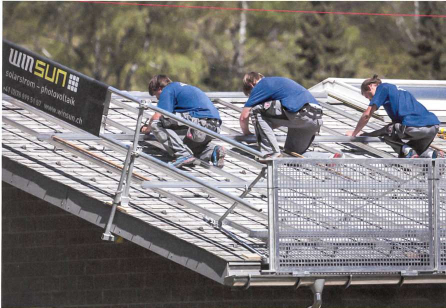
Drei von inzwischen mehr als vierzig Winsun-Angestellten montieren Solarpanels auf einem Walliser Hausdach.

Christa Mutter