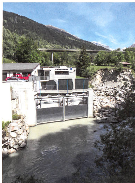
Saniertes Kleinwasserkraftwerk am Wysswasser in Fiesch.