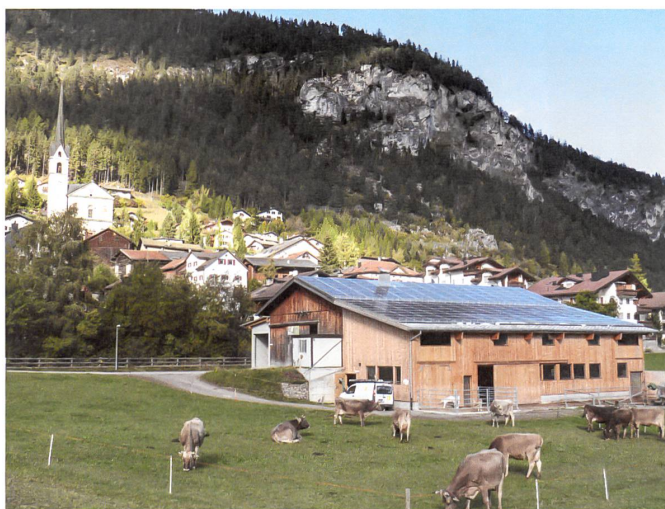
Das Solarkraftwerk auf dem Stall der Familie Negrini in Alvaneu produziert Strom für 14 Haushalte. Projekt: Solarspar