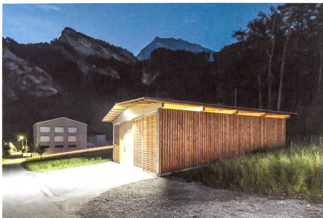
Das Holzkraftwerk von Fläsch. Architektur: Norbert Mathis