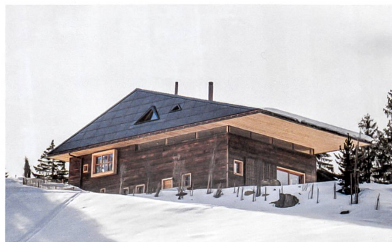
Für das Wohnhaus Sieber in Sörenberg produziert die Sonne viermal mehr Energie, als das Haus braucht. Projekt: Scheitlin Syfrig Architekten