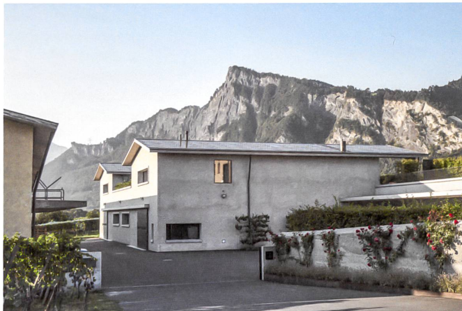
Das Weingut Davaz in Fläsch setzt auf Sonnenenergie und wurde mit dem Solarpreis Schweiz ausgezeichnet. Architektur: Atelier f