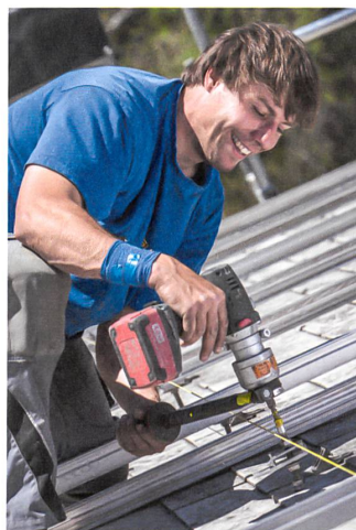
Solaranlagen werden meist von A bis Z selbst aufgebaut.