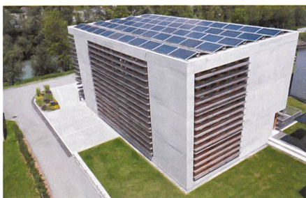
Das Bürohaus Cavigelli in Ilanz produziert mehr als doppelt so viel Energie, als es braucht. Projekt: Vincenz Weishaupt Architekten