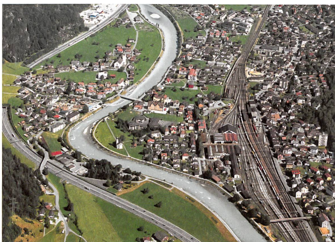
Erstfeld aus der Luft: In der Urner «Energistadt» werden auch viele Solardächer gebaut.