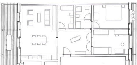
B 3 1/2-Zimmer-Wohnung