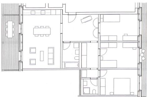
A 4 1/2-Zimmer-Wohnung