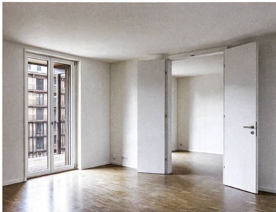
Doppelflügelige Türen erlauben eine vielfältige Nutzung.

→ Was uniform erscheint, zeigt näher besehen fein rhythmisierte Fassaden und eine wohlüberlegte Abstufung in der Materialisierung. Holz ist bei den Langhäusern nicht einfach Holz: Dunkel sind die druckimprägnierten Fassadenelemente, hell die Decken der Veranden, lackiert die runden Stützen. Die charakteristische allseitige Auskrugung der Geschossdecken bildet unterschiedlich tiefe Veranden, während die Fensterbreite je nach Fassade variiert – Ersteres dient dem Witterungsschutz, Letzteres den Minergie-Eco-Anforderungen. Der Privatsphäre geschuldet ist die Unterteilung der Veranda mit Trennwänden. Der pragmatische Eingriff unterlegt die Fassade mit einem Rhythmus von zwei bis vier zusammengehörigen Moduleinheiten. Das Gesamte habe «etwas Japanisches, eine Poetik, in der sich Strenge und Leichtigkeit bedingen», urteilte die Jury damals über Mühlethalers Wettbewerbsbeitrag – und das Lob gilt auch dem Gebauten.