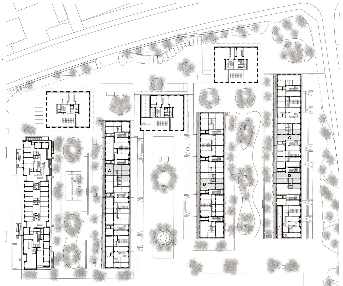
Erdgeschoss mit Umgebung (links Studentenzeile).