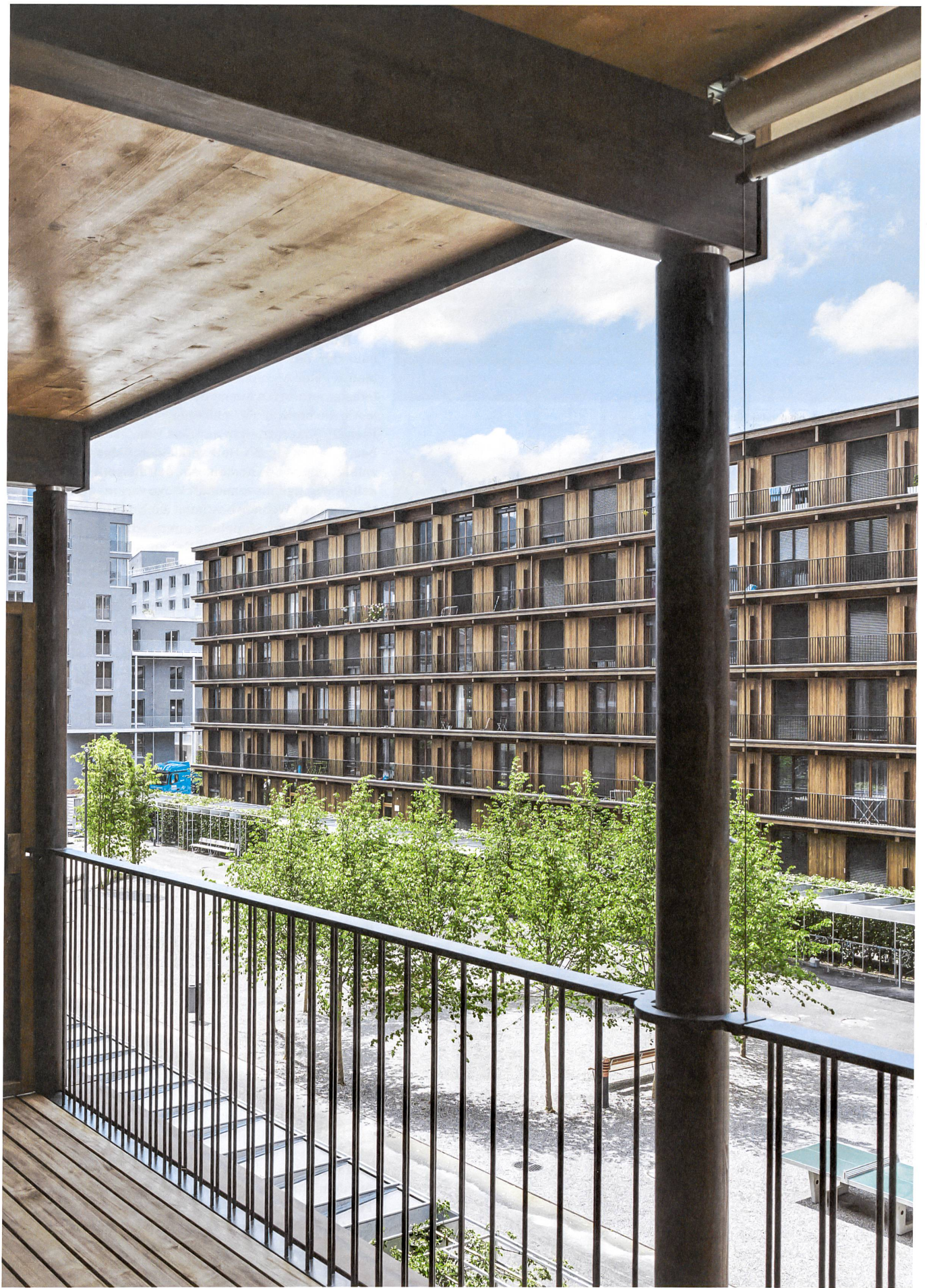
Zwischen Stadtraum und Park: Blick von einer Veranda auf den langgestreckten Innenhof.