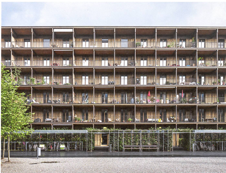
Jede Wohnung besitzt eine laubenähnliche Veranda.