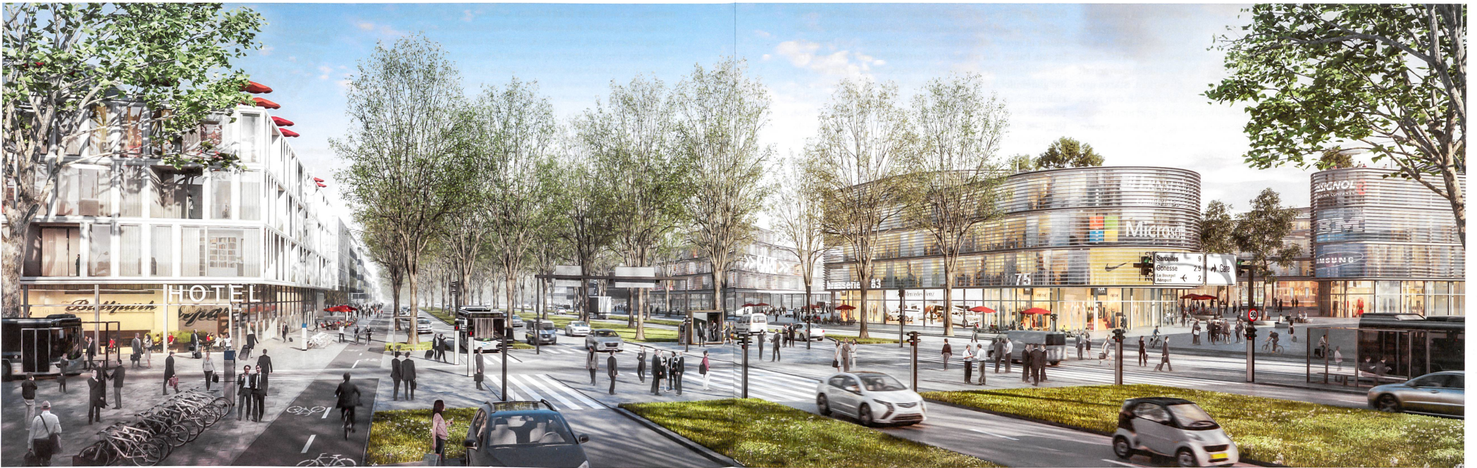
Das Büro Güller Güller plant eine Flughafenstadt im Nordosten von Paris. Herz ist der Bahnhofplatz, der zu Bahn und Metro führt. Die Visualisierung unten zeigt Allerweltsarchitektur entlang des Boulevards du Paris. Es handelt sich aber erst um Bilder zum Masterplan, noch nicht um Bauprojekte. Visualisierungen: Güller Güller / A2 Studio