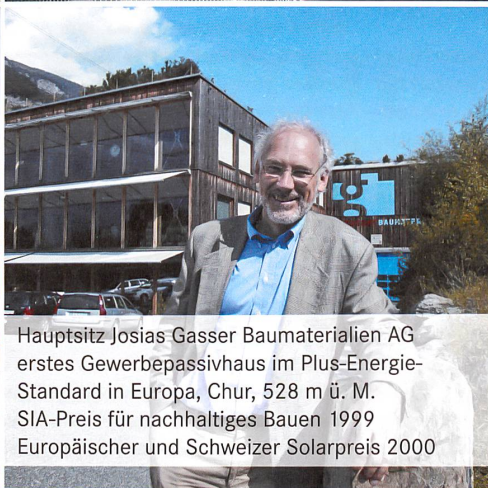
Hauptsitz Josias Gasser Baumaterialien AG erstes Gewerbepassivhaus im Plus-Energie- Standard in Europa, Chur, 528 m ü. M. SIA-Preis für nachhaltiges Bauen 1999 Europäischer und Schweizer Solarpreis 2000