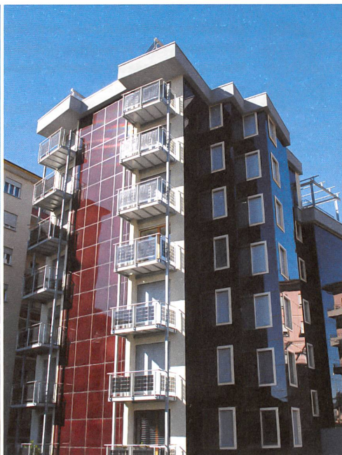
MFH 1965, modernisiert 2013 +114% Plusenergie-MFH, Chiasso, 260 m ü. M. Schweizer Solarpreis 2014