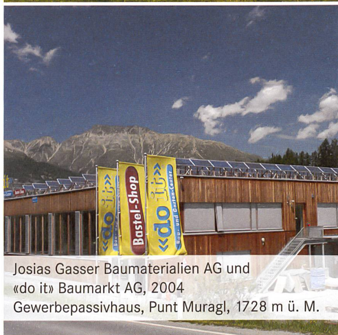
Josias Gasser Baumaterialien AG und «do it» Baumarkt AG, 2004 Gewerbepassivhaus, Punt Muragl, 1728 m ü. M.