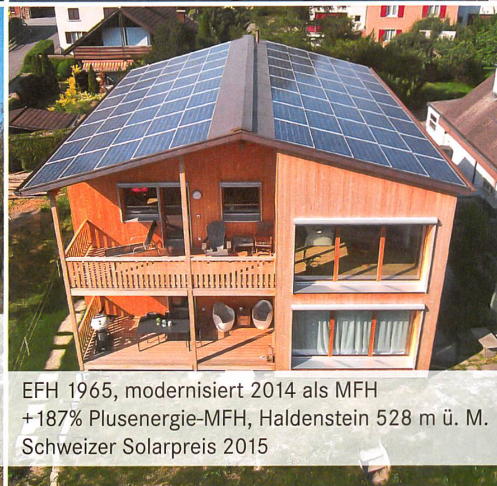
EFH 1965, modernisiert 2014 als MFH +187% Plusenergie-MFH, Haldenstein 528 m ü. M. Schweizer Solarpreis 2015