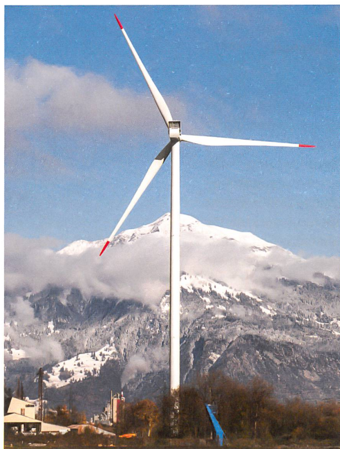
Windenergieanlage «Calandawind», 2013 Haldenstein, 528 m ü. M.