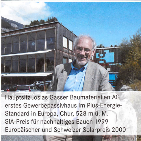
Hauptsitz Josias Gasser Baumaterialien AG erstes Gewerbepassivhaus im Plus-Energie- Standard in Europa, Chur, 528 m ü. M. SIA-Preis für nachhaltiges Bauen 1999 Europäischer und Schweizer Solarpreis 2000