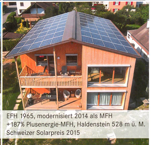
EFH 1965, modernisiert 2014 als MFH +187% Plusenergie-MFH, Haldenstein 528 m ü. M. Schweizer Solarpreis 2015