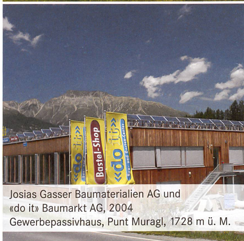
Josias Gasser Baumaterialien AG und «do it» Baumarkt AG, 2004 Gewerbepassivhaus, Punt Muragl, 1728 m ü. M.