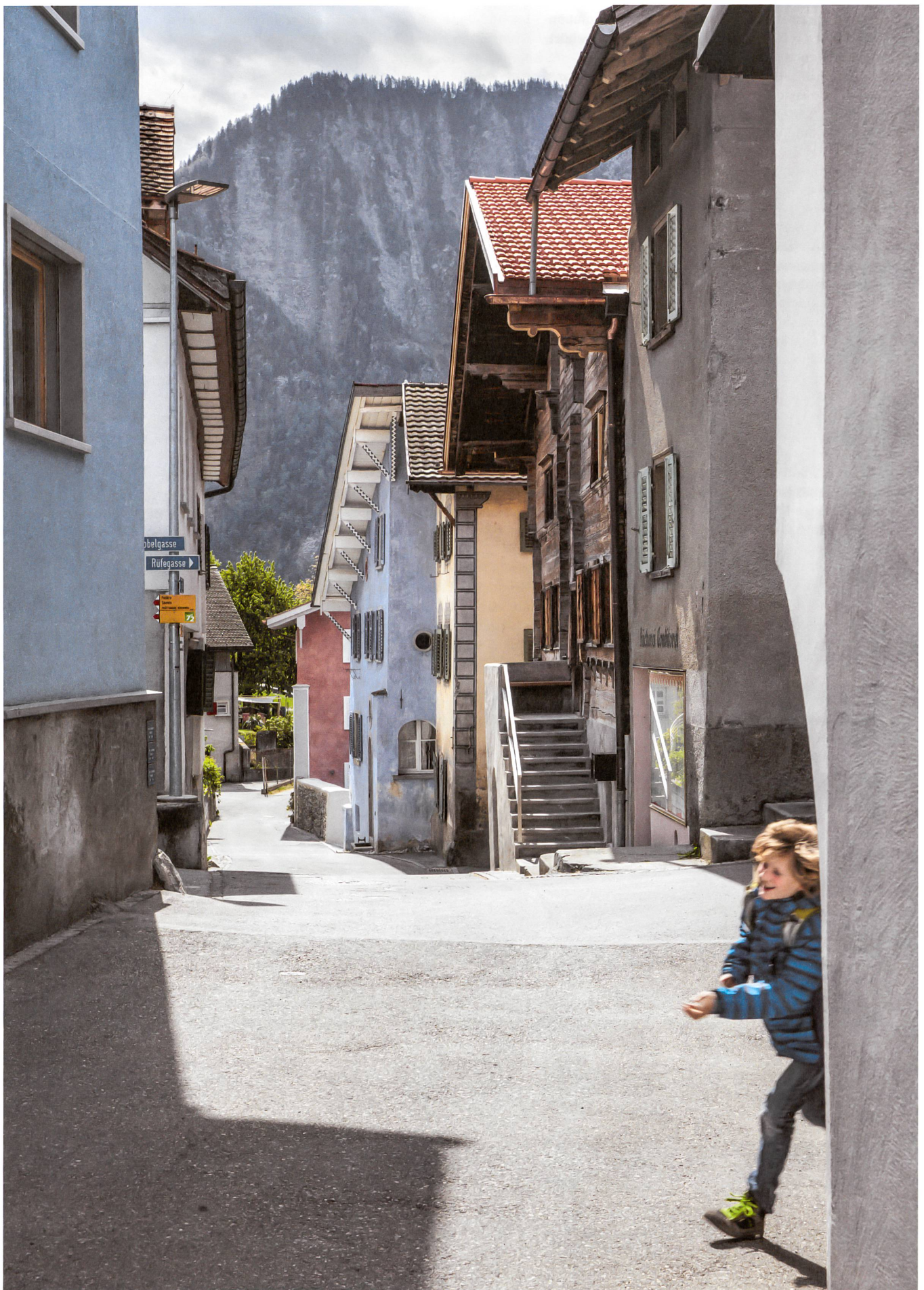
Die städtisch anmutende Tobelgasse war einst eine deutsche Reichsstrasse. Sie konnte ihre Geschichte und räumliche Diversität mit Renovationen bewahren.