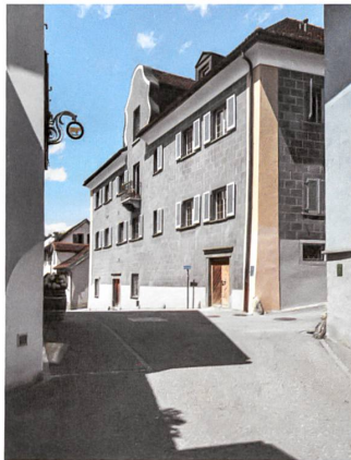
Das Haus Amstein steht wie alle an der Strasse und ist so Haus und Strassenraum.