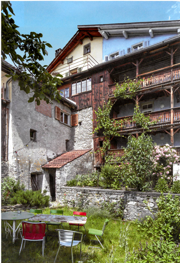
Renoviert statt abgebrochen: zauberhafte Hinterhöfe mit Lauben und Gärten.